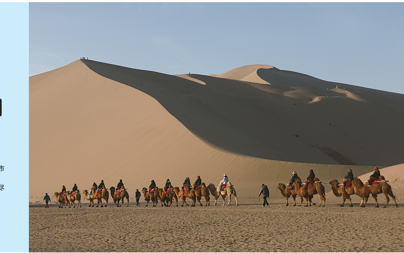
4月5日,游客在甘肃省敦煌市鸣沙山月牙泉景区游览。