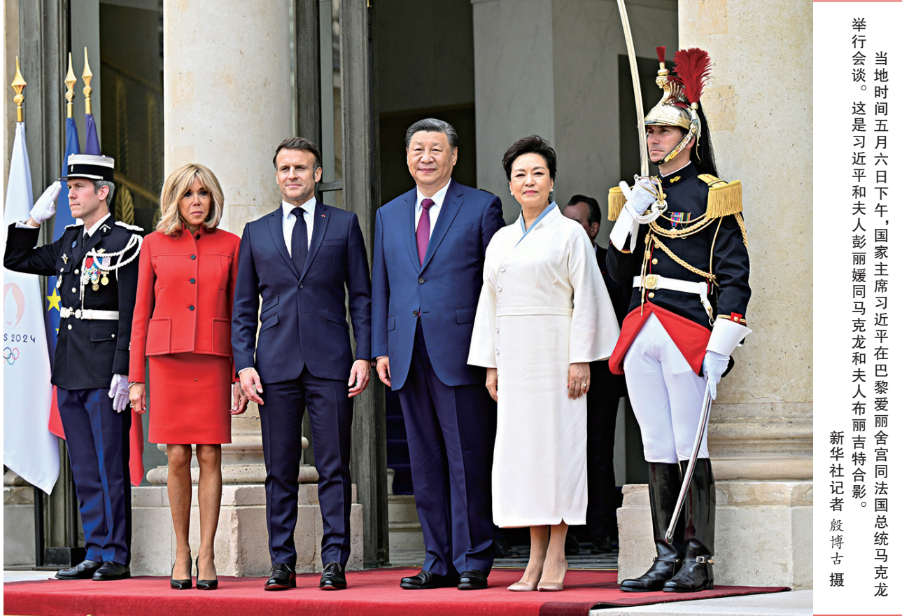
当地时间5月6日下午，国家主席习近平在巴黎爱丽舍宫同法国总统马克龙举行会谈。这是习近平和夫人彭丽媛同马克龙和夫人布丽吉特合影。