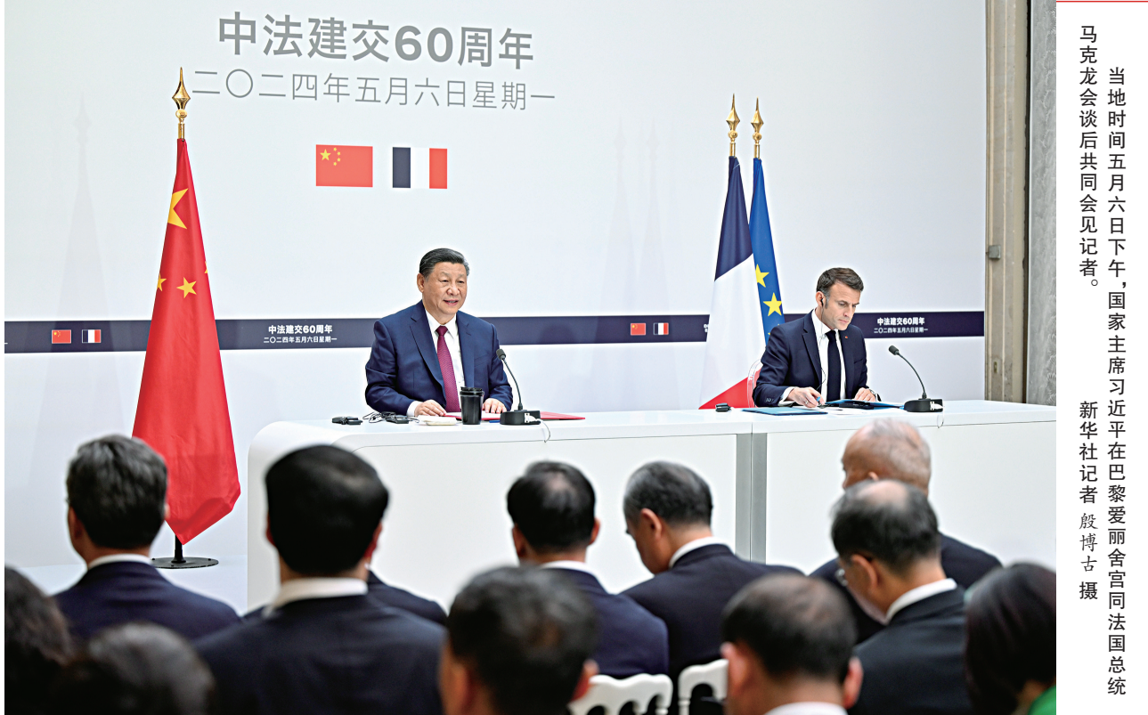
当地时间5月6日下午，国家主席习近平在巴黎爱丽舍宫同法国总统马克龙会谈后共同会见记者。

新华社巴黎5月6日电（记者刘华、郝薇）当地时间5月6日下午，国家主席习近平在巴黎爱丽舍宫同法国总统马克龙会谈后共同会见记者。习近平指出，很高兴应马克龙总