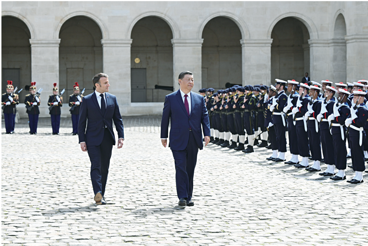
当地时间5月6日下午，正在法国进行国事访问的国家主席习近平在巴黎出席法国总统马克龙举行的隆重盛大欢迎仪式。这是两国元首检阅法兰西共和国卫队和陆海空三军仪仗队。

欢迎仪式后，习近平和彭丽媛在共和国卫队148名骑兵组成的礼兵方队和摩托车队护卫下，乘车前往爱丽舍宫。蔡奇、王毅等参加欢迎仪式。