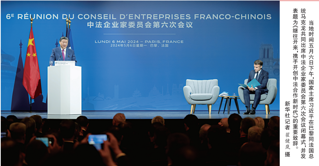
当地时间5月6日下午，国家主席习近平在巴黎同法国总统马克龙共同出席中法企业家委员会第六次会议闭幕式，并发表题为《继往开来，携手开创中法合作新时代》的重要致辞。

新华社巴黎5月6日电（记者韩梁、马峰）当地时间5月6日下午，国家主席习近平在巴黎同法国总统马克龙共同出席中法企业家委员会第六次会议闭幕式，并发表题为《继往开来，携手开创中法合作新时代》的重要致辞。两国元首同中法企业家代表合影，随后共同步入剧院礼堂。在热烈的掌声中，习近平发表致辞。习近平指出，今年是中法建交60周年。60年，在中国传统历法中是一个甲