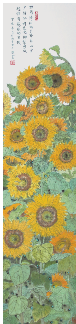
国画小学组一等奖 付雨青 唐山市路南区第三实验小学