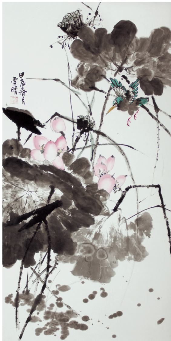
国画小学组一等奖 申雪晴 玉田县城内第三小学