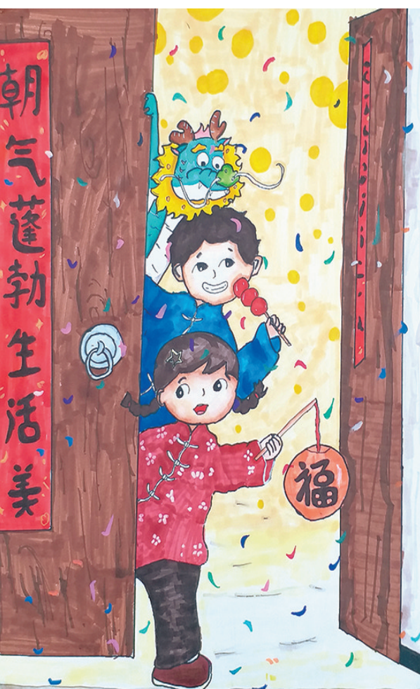
儿童画小学组一等奖 黄雨嘉 迁安市第二实验小学