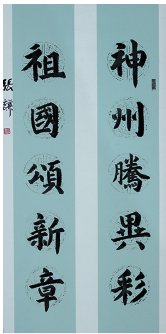
软笔中学组一等奖 张谦 滦南县方各庄镇初级中学