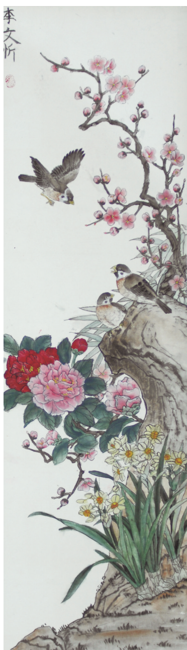
国画小学组一等奖 李文忻 迁安市第一初级中学