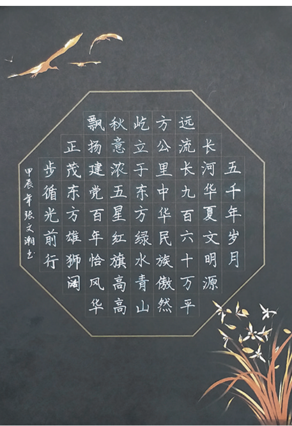
硬笔小学组一等奖 张文潮 唐山市路北区光明实验小学