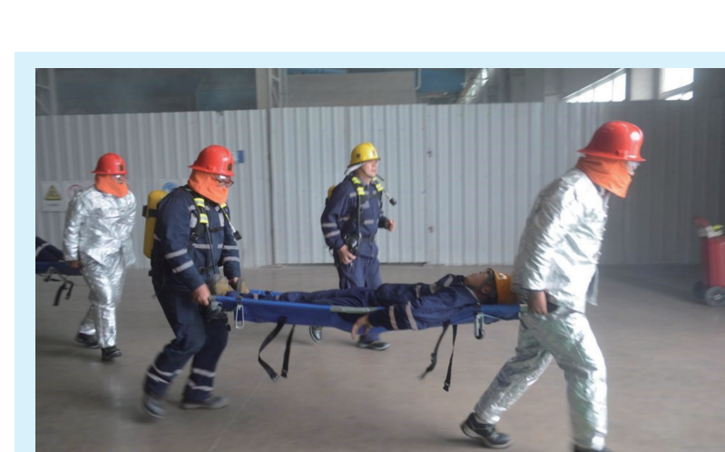
日前,曹妃甸区应急管理局走进热加工有限公司组织召开应急疏散救援演练观摩会。

工、电焊工、计算机程序员比赛同时也是今年河钢集团技能竞赛的选拔赛,成绩优秀者将获得河钢集团大赛参赛资格。