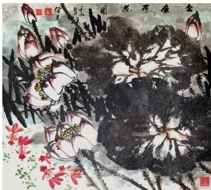
《金鱼荷花图》张俊来