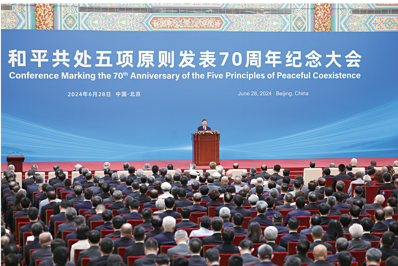
6月28日上午，和平共处五项原则发表70周年纪念大会在北京人民大会堂隆重举行。国家主席习近平出席大会并发表题为《弘扬和平共处五项原则，携手构建人类命运共同体》的重要讲话。

新华社北京6月28日电（记者孙奕、马卓言）6月28日上午，和平共处五项原则发表70周年纪念大会在北京人民大会堂隆重举行。国家主席习近平出席大会并发表题为《弘扬和平共处五项原则，携手构建人类命运共同体》的重要讲话。 仲夏时节，天高云淡。人民大会堂金色大厅，庄严辉煌，高朋满座。上午十时，在恢弘的《和平—命运共同体》乐曲声中，习近平步入金色大厅。 习近平同出席纪念大会的各国政要一一握手，亲切互动。 在热烈的掌声中，习近平发表重要讲话。 习近平指出，在近代以来人类社会发展的历史进程中，处理国与国关系，共同维护世界和平与安宁，促进全人类发展与进步，始终是各国不懈探索的重大命题。70年前，民族独立和解放运动风起云涌，世界殖民体系土崩瓦解。冷战阴云笼罩世界，“强权即公理”甚嚣尘上，刚刚获得独立的新生国家渴望维护国家主权、发展民族经济。中国领导人首次完整提出互相尊重主权和领土完整、互不侵犯、互不干涉内政、平等互利、和平共 处五项原则，并将其纳入中印、中缅联合声明，共同倡导将五项原则确立为指导国家间关系的基本准则。这成为国际关系史上的伟大创举，具有划时代的重大意义。 70年来，和平共处五项原则跨越时空，超越隔阂，经久愈切、历久弥新，成为开放包容、普遍适用的国际关系基本准则和国际法基本原则，为国际关系和国际法治树立了历史标杆，为不同社会制度国家建立和发展关系提供了正确指导，为发展中国家团结合作、联合自强汇聚了强大合力，为国际秩序改革和完善贡献了历史智慧，为人类进步事业作出了不可磨灭的历史贡献。 习近平强调，70年后的今天，面对“建设一个什么样的世界、如何建设这个世界”的重大课题，中国又给出了构建人类命运共同体这个时代答案。构建人类命运共同体理念与和平共处五项原则一脉相承，都植根于亲仁善邻、讲信修睦、协和万邦的中华优秀传统文化，都彰显了中国外交自信自立、坚持正义、扶弱扬善的精神风骨，都体现了中国共产党人为人类作出新的更大贡献的世界情怀，都展现了中国坚持走和平发展道路的坚定决心，是新形势下对和平共处五项原 则最好的传承、弘扬、升华。这一理念立足于国与国命运交织、休戚与共的客观现实，树立了平等和共生的新典范；顺应和平、发展、合作、共赢的时代潮流，开辟了和平和进步的新境界；着眼世界多极化和经济全球化的历史大势，丰富了发展和安全的新实践。 习近平指出，面对和平还是战争、繁荣还是衰退、团结还是对抗的历史抉择，我们比以往任何时候都更加需要弘扬和平共处五项原则的精神内涵，朝着构建人类命运共同体的崇高目标不懈努力。 ——我们要坚持主权平等的原则。倡导平等有序的世界多极化，确保各国都能在多极体系中找到自己的位置，都能在遵守国际法前提下发挥应有的作用，确保世界多极化进程总体稳定和具有建设性。 ——我们要夯实相互尊重的基础。尊重彼此的核心利益和重大关切，尊重各国人民自主选择的发展道路和制度模式，共同维护好干涉别国内政这一“黄金法则”，共同反对把自己的意志强加于人，反对搞阵营对抗和各种“小圈子”，反对强迫别国选边站队。 ——我们要实现和平安全的愿景。共担维护和平责任，（下转第二版）