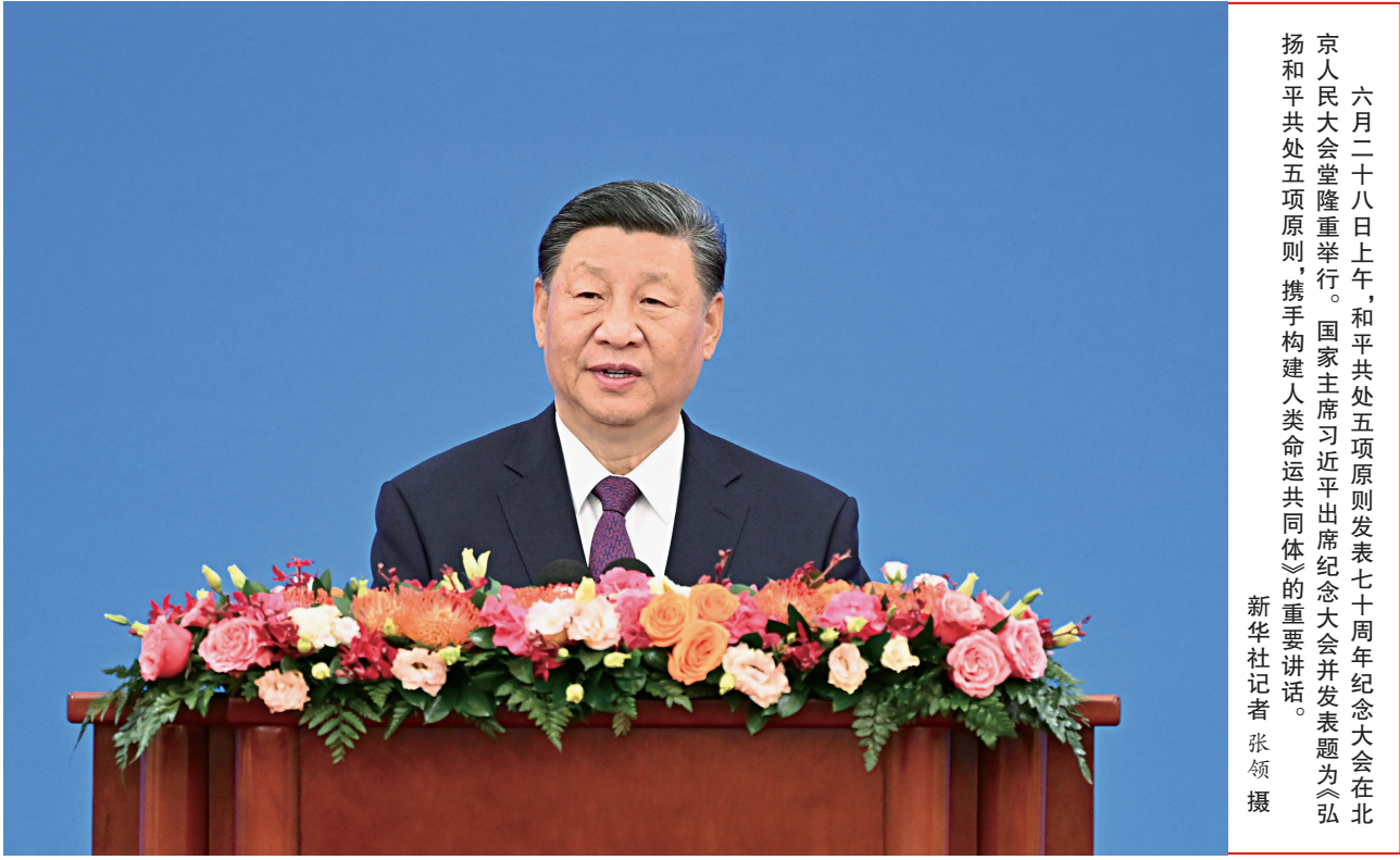
六月二十八日上午，和平共处五项原则发表七十周年纪念大会在北京人民大会堂隆重举行。国家主席习近平出席大会并发表题为《弘扬和平共处五项原则，携手构建人类命运共同体》的重要讲话。