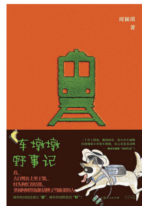
《车墩墩野事记》 周颖琪(著) 光启书局

作者以平和悠长的笔调,记录哈萨克牧民在高山草原夏牧场的生活日常,原生态为我们呈现羊的命运以及围绕着羊的牧人的命运。幽默诚实的描述,一下能戳中当下读者生活的痛点和笑点。