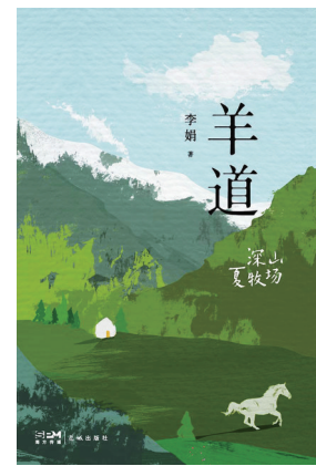
《羊道·深山夏牧场》 李娟(著) 花城出版社

作者用这些亲历的片段和即时的记录,告诉我们,面对父母的衰老是一个不断加强心理建设的过程,也是一个不断冲击认知的过程。面对生病与机能退化,总以为治疗就会好,但最终还是接受这些病痛并与之相伴,尽力在病与退化的间隙,争取一些对生活的快乐。书中记载的那些对父母生病压力时的心态,对生命的思考,是每个人都要面对的。