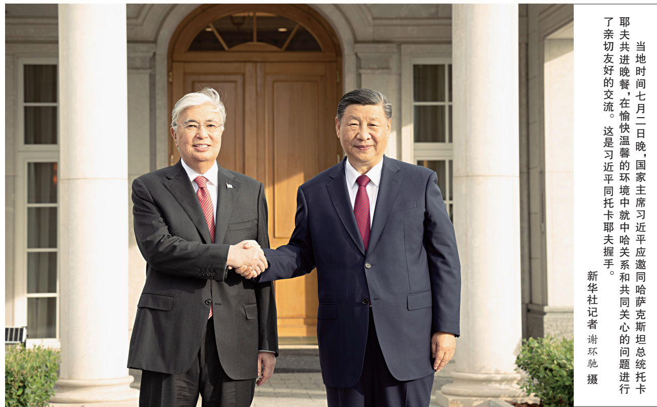
当地时间七月二日晚，国家主席习近平应邀同哈萨克斯坦总统托卡耶夫共进晚餐，在愉快温馨的环境中就中哈关系和共同关心的问题进行了亲切友好的交流。这是习近平同托卡耶夫握手。