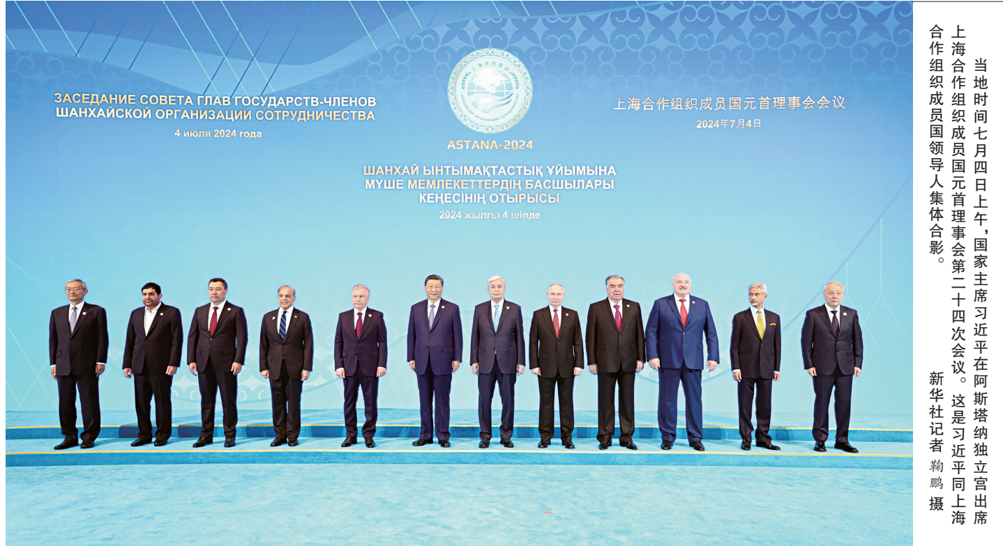
当地时间七月四日上午，国家主席习近平在阿斯塔纳独立宫出席上海合作组织成员国元首理事会第二十四次会议。这是习近平同上海合作组织成员国领导人集体合影。