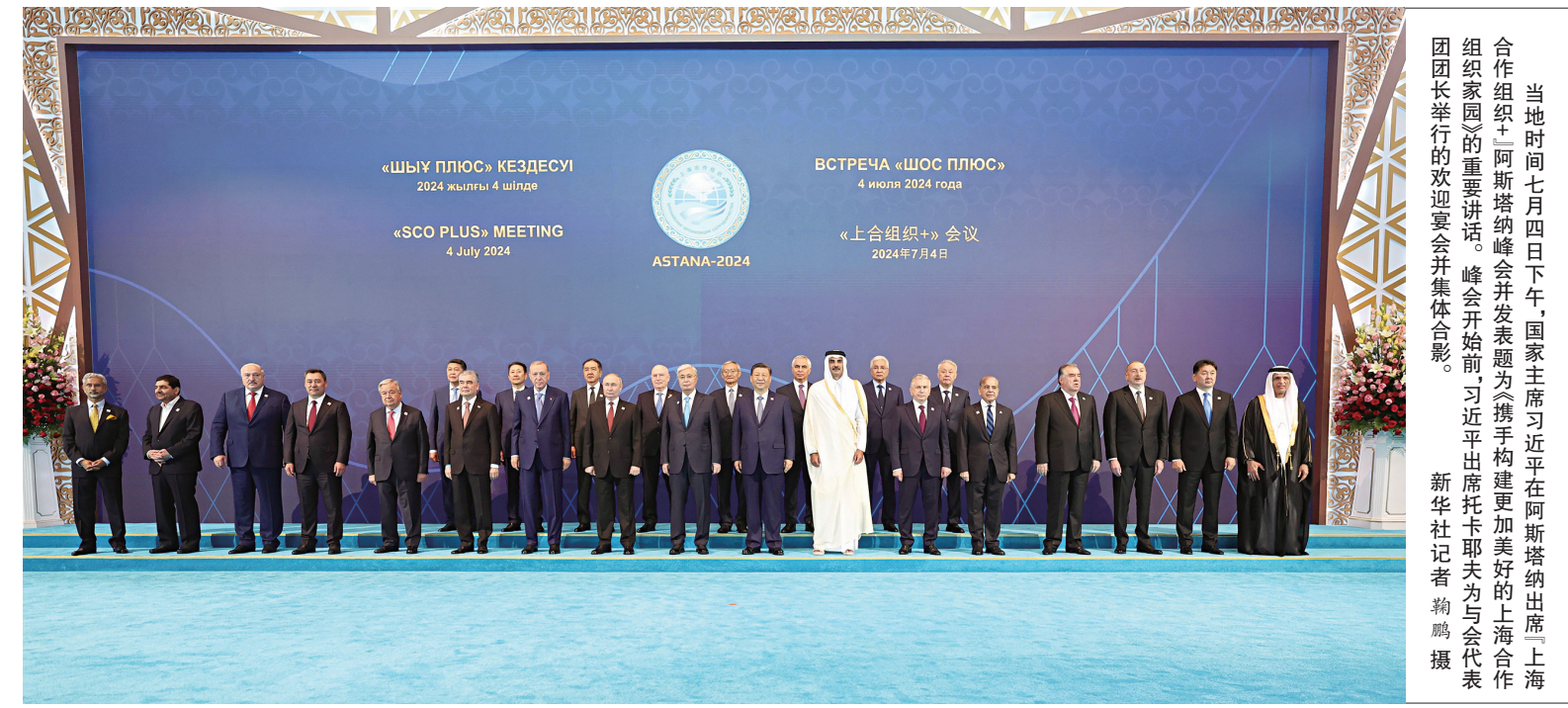
当地时间七月四日下午，国家主席习近平在阿斯塔纳出席“上海合作组织+”阿斯塔纳峰会并发表题为《携手构建更加美好的上海合作组织家园》的重要讲话。峰会开始前，习近平出席托卡耶夫为与会代表团长举行的欢迎宴会并集体合影。