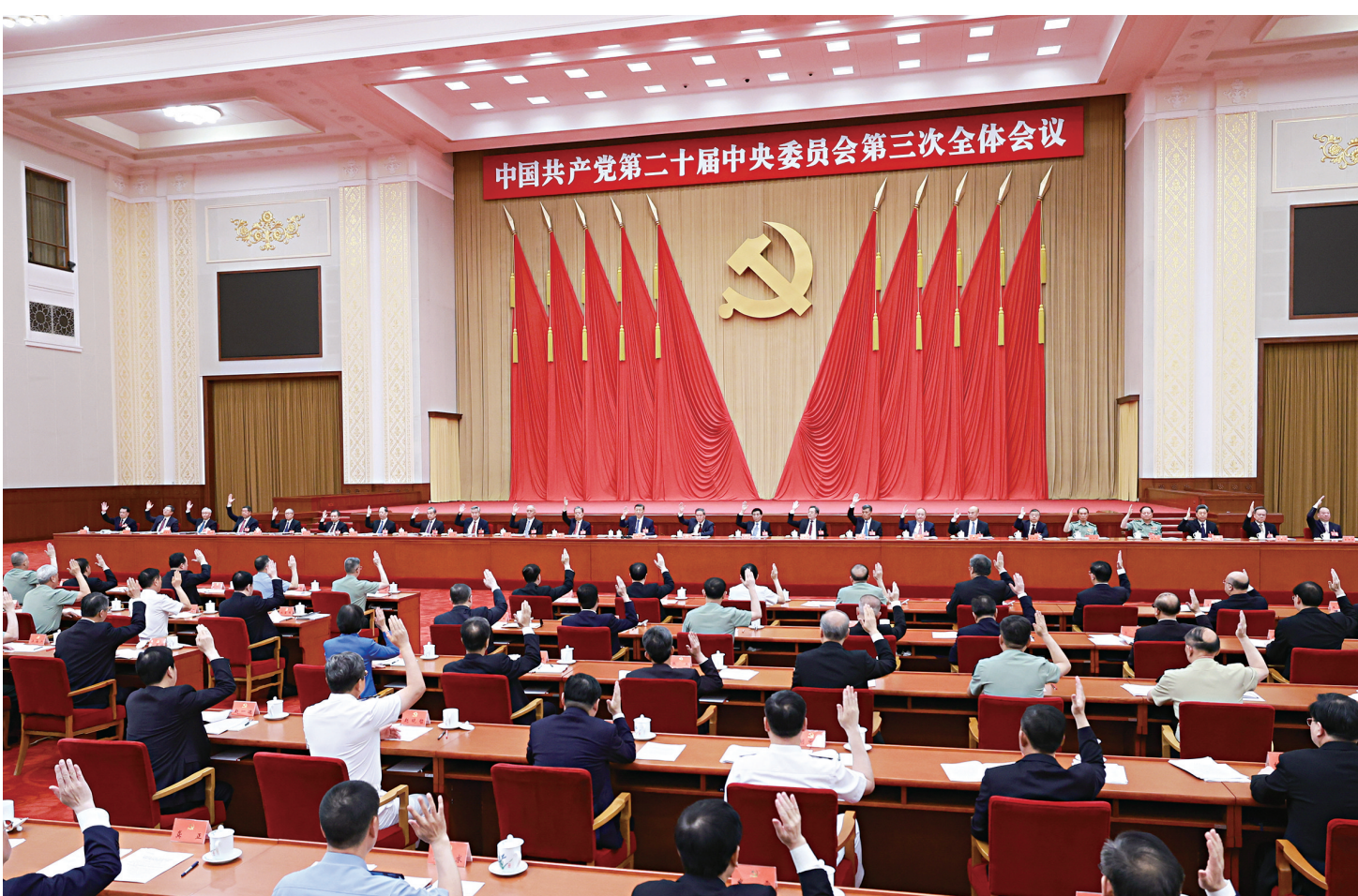
中国共产党第二十届中央委员会第三次全体会议,于2024年7月15日至18日在北京举行。中央委员会总书记习近平作重要讲话。