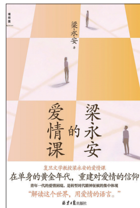
《梁永安的爱情课》 梁永安(著) 北京日报出版社

一篇篇美文,飘出舌尖下的江南味道,无论是食府还是家厨,无论是梅酒还是香螺,你能想象到的口感一一呈现。美食的话题是一张通行长江水系的船票,自青弋江至长江,从秦淮河到苏杭,从新安江到徽州,顺便把江南的文化一并打捞和串联起来,使之日渐丰盈不再是抽象。