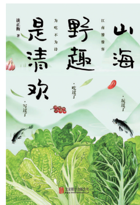
《山野趣是清欢》 谈正衡(著) 北京联合出版公司

收录作者近三年20篇新作,以及重新改写之增补了阅读量过百万的近两年江南美食文章精华。外加家常的时令蔬菜、乡间的野味、酒店的招牌菜、街坊的小吃应有尽有。看起来制作复杂、需要手艺的菜,有乡土气息浓厚的农家美味,有江南地区的饮食文化,有回忆里的岁月人情冷暖。