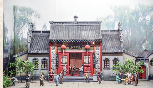
广东会馆微缩景观。资料片

里香、九美斋、鸿宴饭庄等一大批知名品牌先后涌现。说书、戏曲、皮影戏等曲艺行当、街头卖艺大量汇集,众多手工业者也聚集于此谋生。这些事物的产生与发展,与以广东为代表的各地文化涌入融合有极大关系。