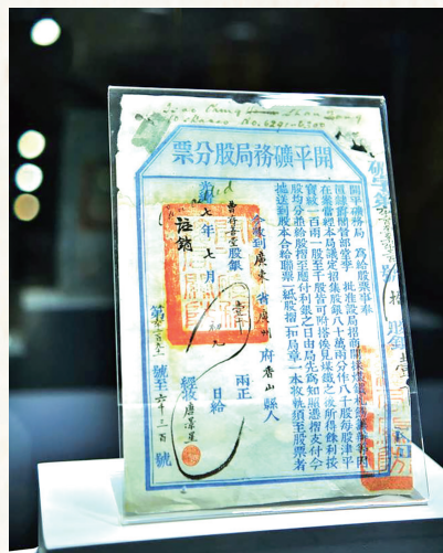
开平矿务局股份票。资料片

九十一号至六千三百号(标点为文章作者后加)。”股票上的“经收”署名“唐景星”,就是唐廷枢其人。