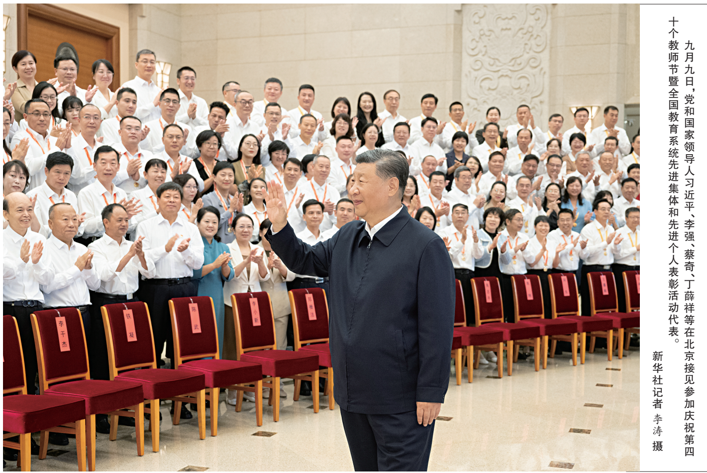
九月九日，党和国家领导人习近平、李强、蔡奇、丁薛祥等在北京接见参加庆祝第十个教师节暨全国教育系统先进集体和先进个人表彰活动代表。

新华社北京9月10日电 全国教育大会9日至10日在北京召开。中共中央总书记、国家主席、中央军委主席习近平出席大会并发表重要讲话。他强调，建成教育强国是近代以来中华民族梦寐以求的美好愿望，是实现以中国式现代化全面推进强国建设、民族复兴伟业的先导任务、坚实基础、战略支撑，必须朝着既定目标扎实迈进。