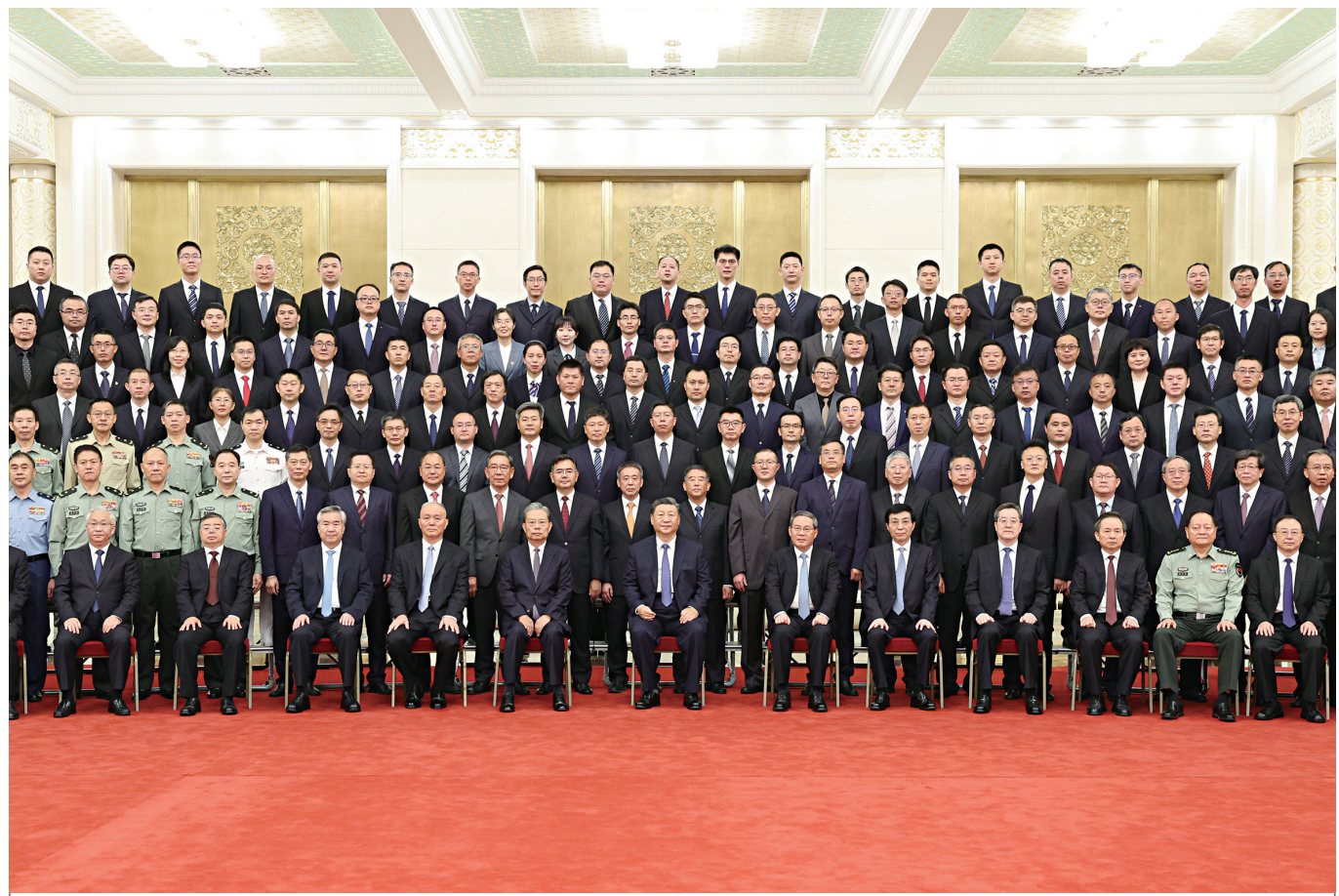
9月23日，党和国家领导人习近平、李强、赵乐际、王沪宁、蔡奇、丁薛祥、李希等在人民大会堂会见探月工程嫦娥六号任务参研参试人员代表并参观月球样品和探月工程成果展览。这是习近平发表重要讲话。