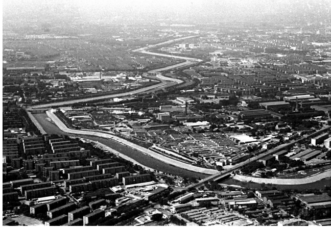
▲改革开放初期的陡河市区段。 ▶如今，环城水系陡河段水清岸绿，高楼林立，洋溢着现代气息。