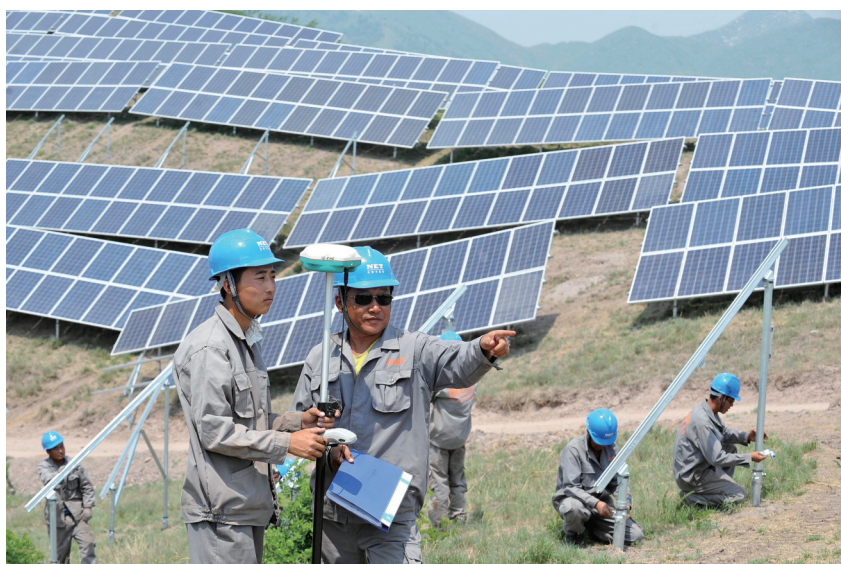
我市充分发挥北部荒山荒坡、南部沿海滩涂等资源优势,有序发展集中式地面电站,积极打造百万千瓦级光伏基地。