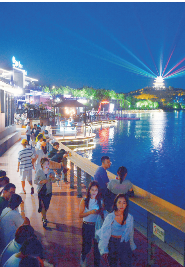
南湖公园从昔日采煤沉降地变身市民流连忘返的城市生态公园。