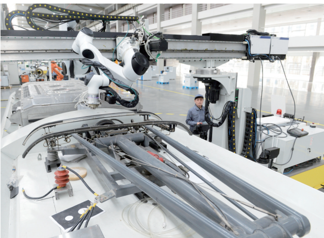
经过多年来的建设,唐山已形成涵盖机器人整机制造、机器人系统集成、传感器及关键部件制造、工业自动化设备生产和机器人配套服务的全链条产业集群,“机器人+”广泛应用于钢铁冶金、船舶制造、轨道交通、教育医疗等场景。图为唐山百川智能机器股份有限公司城市轨道交通智慧运维装备制造基地,车顶智能检修机器人正在作业。