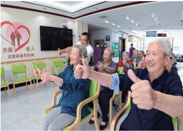
唐山市立足老年人口多、老龄化速度快、青年群体聚集、养老托育需求多元的实际,坚持“群众所需、党群所急、政府所能”,聚焦兜底性、普惠性、多元性,用心用力织牢“一老一小”民生保障网,让民生福祉更有保障、基层治理更有温度、城市发展更有动力。图为古冶区怡然安养老院创新养老服务理念,在全国率先打造“快乐养老”模式。