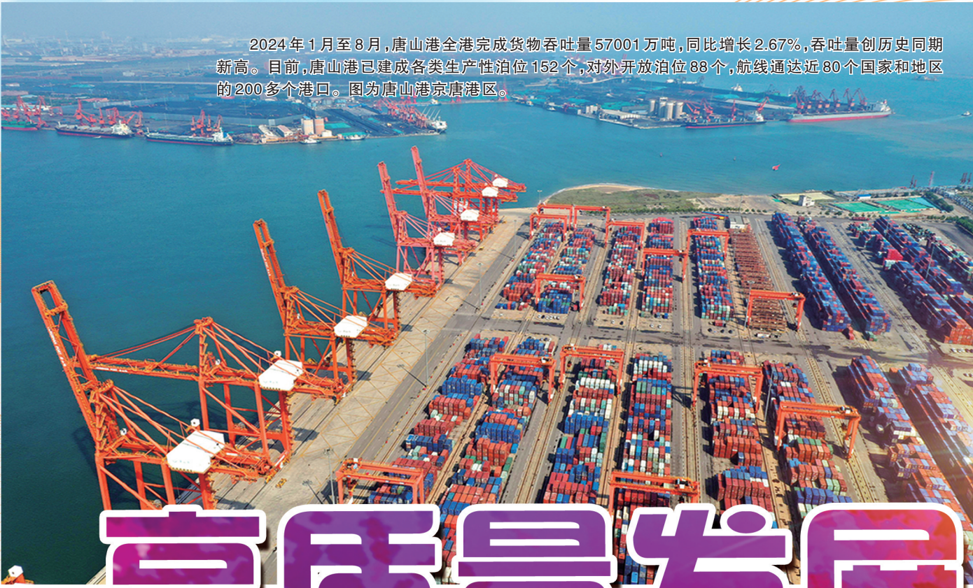
2024年1月至8月,唐山港全港完成货物吞吐量57001万吨,同比增长2.67%,吞吐量创历史同期新高。目前,唐山港已建成各类生产性泊位152个,对外开放泊位88个,航线通达近80个国家和地区的200多个港口。图为唐山港京唐港区。

唐山北靠燕山、南临渤海、毗邻京津,地处东北亚经济区的中心地带,在京津冀协同发展和“一带一路”建设中具有重要地位,是京津冀区域性中心城市。唐山是中国近代工业的摇篮,自1878年兴办开滦煤矿,唐山近现代工业已经走过了140多年的历程,创造了中国近代工业的“七个第一”,新中国成立75年来,唐山铸就了“铁肩担道义”的大钊精神,开滦工人“特别能战斗”精神,遵化王国藩合作社的“穷棒子”精神,沙石峪万里千担一亩田的“当代愚公”精神,“公而忘私、患难与共、百折不挠、勇往直前”的抗震精神。