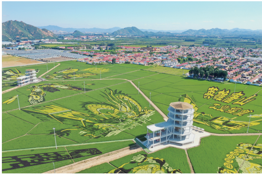
我市聚焦乡村振兴,激发农业农村内生活力。乡村振兴统筹推进,全面推进“十百千”工程,创建省级和美乡村564个,和美乡村示范村87个。图为山里各庄乡村振兴综合体。