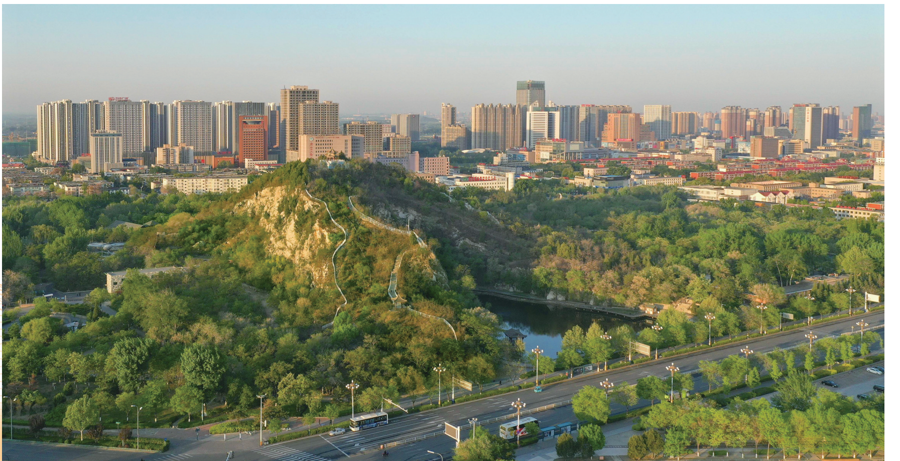
我市持续保持国家森林城市称号,11个县(市、区)建成省级森林城市,森林城市群初步形成。