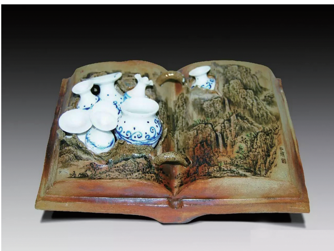
《醉卧山水间》程红璞