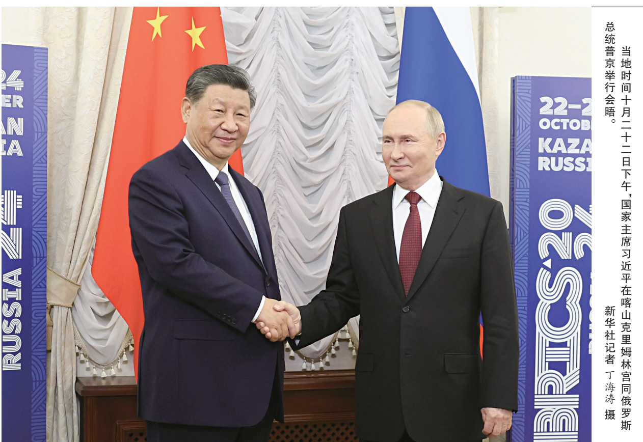
当地时间十月二十二日下午，国家主席习近平在喀山克里姆林宫同俄罗斯总统普京举行会晤。

新华社俄罗斯喀山10月22日电（记者郝薇、黄河）当地时间10月22日下午，国家主席习近平在喀山克里姆林宫同俄罗斯总统普京举行会晤。 习近平指出，今年是中俄建交75周年。75年来，中俄关系风雨兼程，探索出“不结盟、不对抗、不针对第三方”的相邻大国正确相处之道。双方秉持永久睦邻友好、全面战略协作、互利合作共赢精神，不断深化和拓展全面战略协作和各领域务实合作，为推动两国发展振兴和现代化建设注入强劲动力，为增进中俄人民福祉、维护国际公平正义作出重要贡献。当前，世界正处于百年未有之大变局，国际形势变幻莫测，但中俄世代友好的深厚情谊不会变，济世为民的大国担当不会变。尽管面临复杂严峻的外部形势，两国贸易等各合作领域积极推进，大型合作项目稳定运营。双方要继续推动共建“一带一路”倡议和欧亚经济联盟深入对接，为促进各自经济高质量发展提供动力支撑。 习近平强调，明年是联合国成立80周年，也是世界反法西斯战争胜利80周年。作为联合国安理会常任理事国和世界主要大国，中俄要深化全面战略协作，密切在联合国、上海合作组织等多边框架内沟通协调，弘扬正确二战史观，坚定维护以联合国为核心的国际体系，共同维护全球战略稳定，维护国际公平正义。 习近平指出，金砖合作机制是当今世界最重要的新兴市场国家和发展中国家团结合作平台。中方高度评价俄罗斯作为主席国为此次金砖国家领导人会晤所做工作，期待同金砖国家领导人深入探讨金砖合作机制未来发展，推动各方凝聚共识，传递团结合作的积极信号，推进金砖国家各领域战略协作和务实合作，为全球南方争取更多新机遇。 普京表示，不久前，我们共同庆祝俄中建交75周年。75年来，俄中已经发展成为新时代全面战略合作伙伴，两国关系保持高水平发展，树立了新型大国关系的典范。俄中合作基于平等、相互尊重和互利互惠。在双方共同努力下，目前两国各领域务实合作持续推进，俄中文化年各项活动顺利举办。俄方希望同中方进一步深化合作，助力两国发展振兴。明年是第二次世界大战结束80周年。俄中为世界反法西斯战争胜利付出了巨大牺牲，俄方愿同中方共同纪念这一重要时间节点。俄方愿同中方继续保持密切高层交往以及在国际事务中的战略沟通协作，共同维护国际公平正义和全球战略稳定。感谢中方在俄方担任金砖国家主席国期间提供有力支持，俄方愿同中方密切配合，确保金砖扩员后首次领导人会晤取得成功，推动“大金砖合作”不断取得积极成果。 两国元首就共同关心的重大国际地区问题深入交换了意见。蔡奇、王毅等参加会晤。