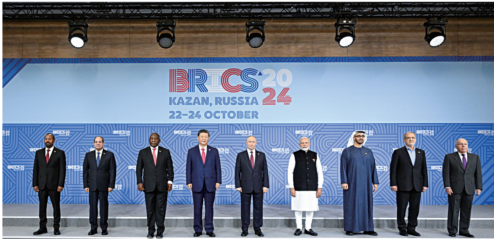
当地时间10月23日上午,金砖国家领导人第十六次会晤在喀山会展中心举行。俄罗斯总统普京主持会晤。中国国家主席习近平、巴西总统卢拉(线上)、埃及总统塞西、埃塞俄比亚总理阿比、印度总理莫迪、伊朗总统佩泽希齐扬、南非总统拉马福萨、阿联酋总统穆罕默德等出席。这是会晤期间,金砖国家领导人集体合影。

新华社俄罗斯喀山10月23日电(记者倪四义、胡晓光)当地时间10月23日上午,金砖国家领导人第十六次会晤在喀山会展中心举行。俄罗斯总统普京主持会晤。中国国家主席习近平、巴西总统卢拉(线上)、埃及总统塞西、埃塞俄比亚总理阿比、印度总理莫迪、伊朗总统佩泽希齐扬、南非总统拉马福萨、阿联酋总统穆罕默德等出席。