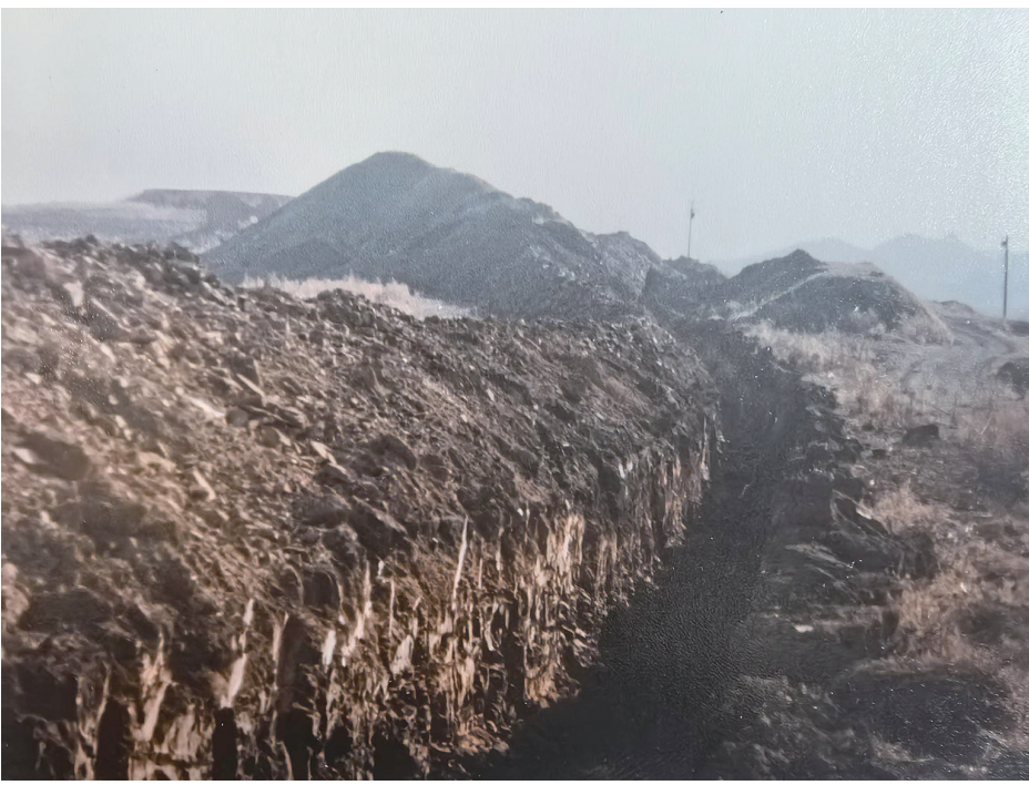
潘庄古瓷窑所在地外景