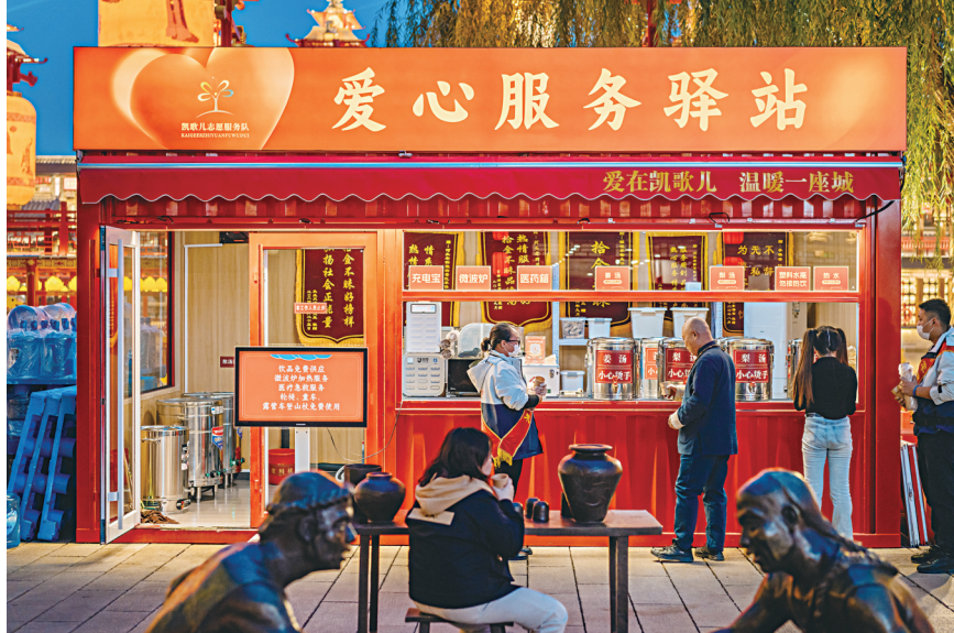
图为游客在爱心服务驿站品尝免费提供的暖心梨汤。

近年来,河头老街景区致力于提升旅游品质,细化服务举措,希望让每一位游客都能在这里留下美好的回忆。而其中最让人称赞的,莫过于设立的爱心服务驿站。在寒冷的冬天,爱心服务驿站准备了