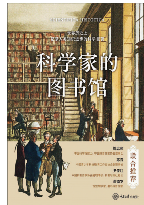
《科学家的图书馆》 布莱恩·克拉克(著) 重庆大学出版社

本书讲述了16位经典童书作家作品背后的故事。他们是毕翠克丝·波特、林格伦、新美南吉、托芙·扬松、罗尔德·达尔、嘉贝丽·文生、米切尔·恩德、桑贝、希尔弗斯坦、昆廷·布莱克、雷蒙德·布里格斯、玛丽莲·布洛克·戈夫斯坦、安房直子、安东尼·布朗、长谷川义史、莫·威廉斯。 16篇文章，每一篇写一个世界级童书大师，展现他们的人生经历、儿童观、创作方法、日常中的灵感时刻、在出版领域的合作细节，还有他们所处时代的纷繁变化。以16位童书大师的人生经历，揭示出：创作如何从具体的人的生活中生长出来。什么样的作品具有不会被时间磨灭的价值。什么样的人能创作出具有永恒价值的作品。