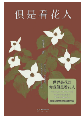
《俱是看花人》 李叶飞(著) 湖南美术出版社

这是一部探究科学书籍历史及其对科学发展的影响的科普作品。本书跨越五个时期，以细腻的笔触勾勒出了从古代至21世纪科学书籍2500年的变迁，以及它们如何塑造人类对世界的认知，通过丰富的案例和深入的分析，展示了科学书籍在传播科学知识、推动科学发展中的重要作用。 书中不仅详述了经典科学书籍的辉煌，还探讨了现代媒介如电视节目对科学普及的深远影响，展现了科普形式的多元化与融合趋势。以书为媒，串联起人类探索未知、追求真理的壮丽篇章。尽管传播媒介在不断更新，书籍作为知识传播的重要载体，其价值和作用仍是不可替代的。