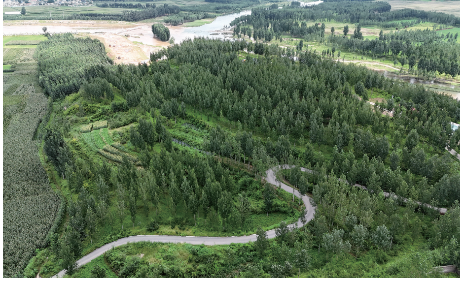
万军山脚下的树林与庄稼。

公布为第五批省级重点文物保护单位。1990年3月,河北省文物局组织的文物普查队在迁安境内普查时发现此遗址。遗址面积1.5万平方米。1992年6月3日至7月4日进行试掘,试掘面积200平方米,出土文物有盆、红顶钵、陶鬲等陶器,还出土了大量石器。