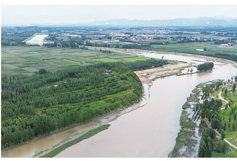
万军山脚下的青龙河。

部。第二层为夏家店上层文化,出土器物主要为陶器,器形有夹砂红褐陶的素面碗、盂等。第三层为魏营子类型文化遗存,只见几个灰坑,出土陶器主要为碗、罐、盆等。第四层为夏家店下层文化遗存,出土器物数量较多,多为陶器,器形主要有夹砂陶绳纹碗、瓢、鼎、盆等。第五层为红山文化遗存,出土器物为陶器和石器,陶器主要为泥质红陶钵及红顶钵,发现1片彩陶片;石器有石斧、石铲、网坠等。第六层为赵宝沟类型文化,出土器物为陶器和石器,陶器以各类夹砂红褐陶的筒形罐为主,也有部分泥质黑皮几何形纹圈足碗、泥质红陶钵及红顶钵、筒形罐纹饰主要为“之”字形纹、刻划纹、戳印纹等。石器多为网坠。