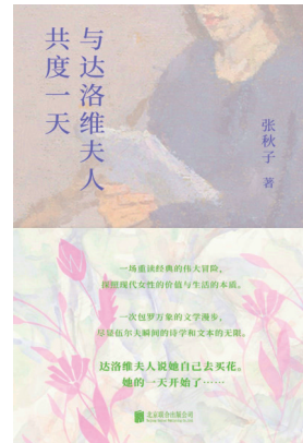
《与达洛维夫人共度一天》 张秋子(著) 北京联合出版公司

天生会讲故事的人,用天真的眼睛观察、感受,触碰读者心底那些来不及收拾的情感和遗憾,也勾动了我的私人记忆。本书为小开本,单手可握,随行阅读无压力;精美双封诠释“破茧”意象,共同构成每个人的内里与外在,既渺小又伟大。