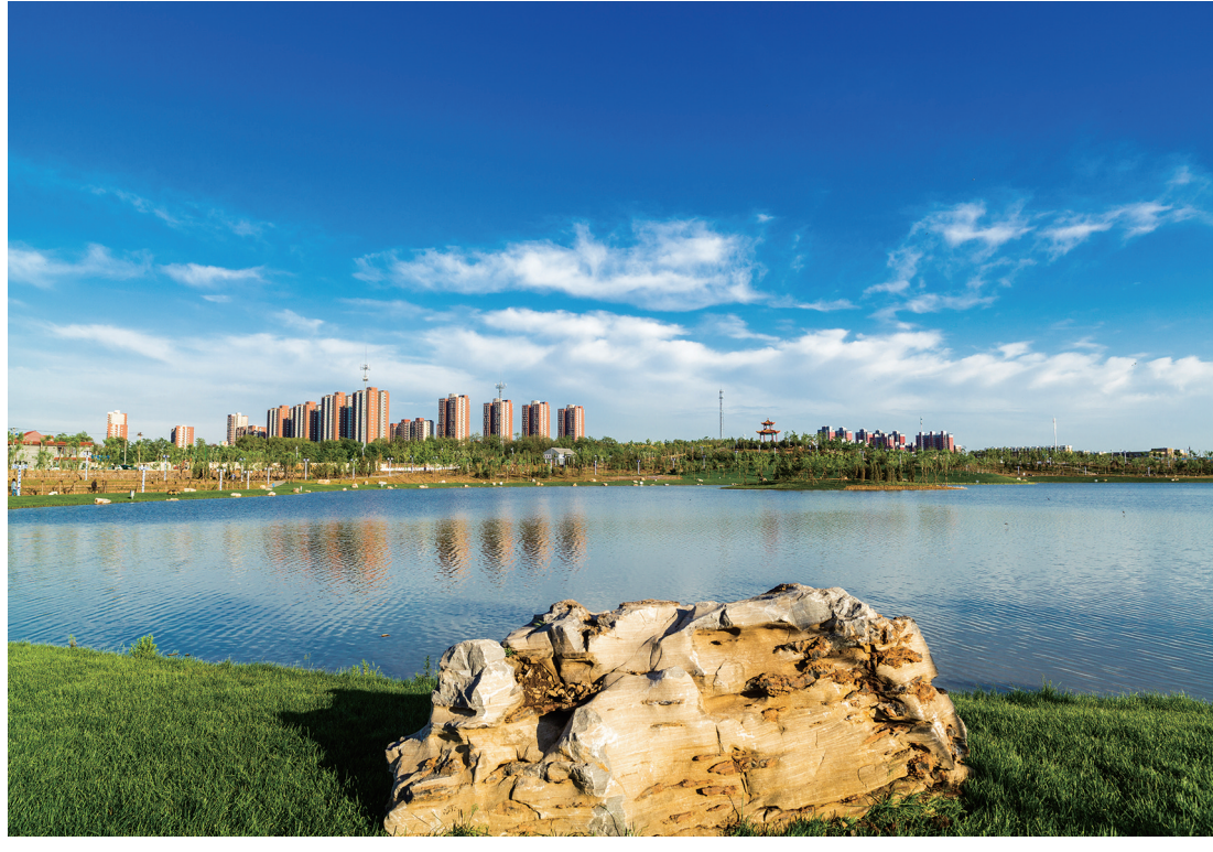
石风 陆北 摄