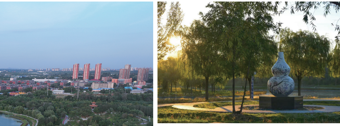
本组图片取景于唐山陶瓷公园。

近年来,路北城市公共绿地海绵城市建设项目聚焦“山、城、湖”一体的老工业区空间特征,结合土地整备“拆改留”的更新条件和旅游、文创、科创策划资源,将城市更新与海绵城市有机融合,以目标和问题为导向,系统串联海绵滑雪场建设、基础设施补短板、超标雨水排放、公园水生态修复和雨洪调蓄建设等海绵工程措施,通过片区蓝绿空间布局网络优化,强化设施系统建设与海绵综合效益,协同提升区域内涝风险应对能力、保障湖体水质稳定达标、提高雨水资源利用水平,进一步夯实城市生态基底。