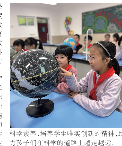
科学素养,培养学生求真务实的精神,助力孩子们在科学的道路上越走越远。

在课内,老师们通过“加”操作,“加”科研、“加”特色,创新教学模式,激发学生科学学习兴趣;在课外,老师和孩子们一起动手动脑“加”拓展、“加”趣味、“加”衔接,不断激发学生潜能,提升学生探究能力。未来,学校将继续开设更加精彩的科学课程,深入开展丰富的校园科技活动,做好科学教育“加法”,不断提升学生