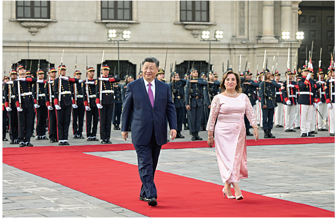
当地时间11月14日下午，国家主席习近平在利马总统府同秘鲁总统博鲁阿尔特举行会谈。博鲁阿尔特在总统府前广场为习近平举行隆重盛大欢迎仪式。

新华社利马11月14日电（记者倪四义、郝薇）当地时间11月14日下午，国家主席习近平在利马总统府同秘鲁总统博鲁阿尔特举行会谈。初夏时节的利马，阳光明媚，鲜花盛开。在秘鲁礼宾部队护卫下，习近平乘车抵达总统府，受到博鲁阿尔特总统热情迎接。博鲁阿尔特在总统府前广场为习近平举行隆重盛大欢迎仪式。两国元首分别向对方陪同人员握手致意。习近平在博鲁阿尔特陪同下检阅仪仗队，军乐团奏中秘两国国歌。欢迎仪式后，两国元首举行会谈。习近平指出，这是我第三次访问秘鲁，也是一年时间里第三次同总统女士会晤。许多秘鲁民众自发聚集道路两旁，挥手致意表示欢迎，让我深切感受到秘鲁人民对中国人民的友好情谊。中秘同为文明古国。古老文明的深厚积淀，赋予中秘两国智慧和胸怀，让我们能够看清历史前进方向，顺应时代发展潮流，始终坚持平等相待、互尊互信、互学互鉴，成为不同体量、不同制度、不同文化国家团结合作的典范。建交53年来，特别是我2016年对秘鲁进行首次国事访问以来，在双方共同努力下，中秘贸易投资合作快速增长，为两国人民带来实实在在的福祉。双方要总结经验，推动两国务实合作提质升级，使中秘全面战略伙伴关系不断迈上新台阶，更好造福两国人民。习近平指出，双方要对接发展战略，深挖合作潜力，打造务实合作新格局，加强贸易和投资“双轮驱动”，推动传统产业和新兴产业“两翼齐飞”，促进产业链和供应链“两链融通”。中方愿继续扩大进口秘鲁特色优质农产品，鼓励有实力的中国企业赴秘鲁