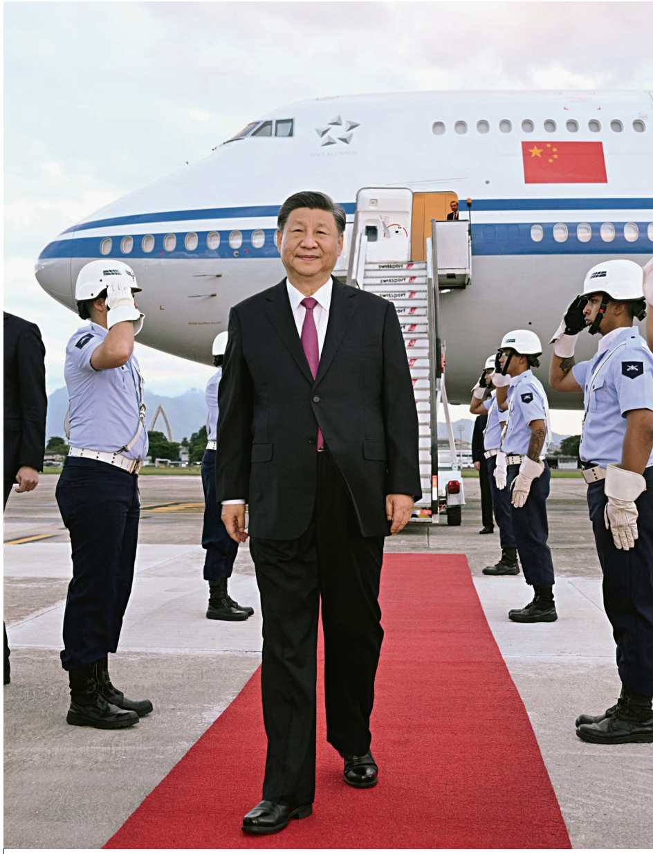
当地时间11月17日下午,国家主席习近平乘专机抵达里约热内卢,应巴西联邦共和国总统卢拉邀请,出席二十国集团领导人第十九次峰会并对巴西进行国事访问。

新华社里约热内卢11月17日电(记者陈威华、马峰)当地时间11月17日下午,国家主席习近平乘专机抵达里约热内卢,应巴西联邦共和国总统卢拉邀请,出席二十国集团领导人第十九次峰会并对巴西进行国事访问。