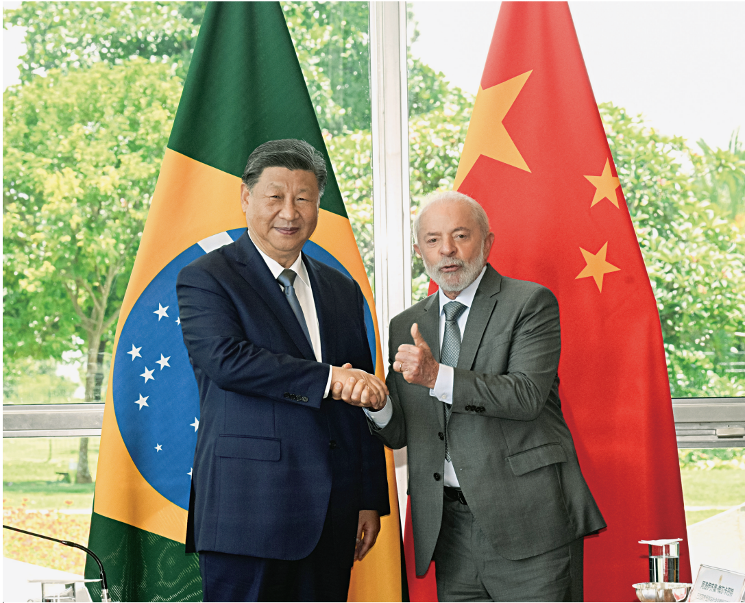
当地时间11月20日上午，国家主席习近平在巴西利亚总统官邸黎明宫同巴西总统卢拉举行会谈。