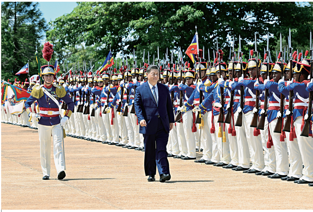
当地时间11月20日上午，国家主席习近平在巴西利亚总统官邸黎明宫同巴西总统卢拉举行会谈。会谈前，卢拉总统和夫人罗桑热拉热情迎接习近平，并为习近平举行隆重盛大欢迎仪式。