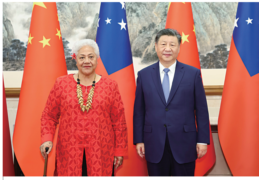
11月26日下午,国家主席习近平在北京钓鱼台国宾馆会见来华进行正式访问的萨摩亚总理菲娅梅。

菲娅梅表示,在习近平主席杰出领导下,中国取得巨大发展成就,为全球南方国家树立了榜样,萨方愿意学习借鉴中国式现代化特别是习近平主席有关减贫、绿色发展等治国理政经验。