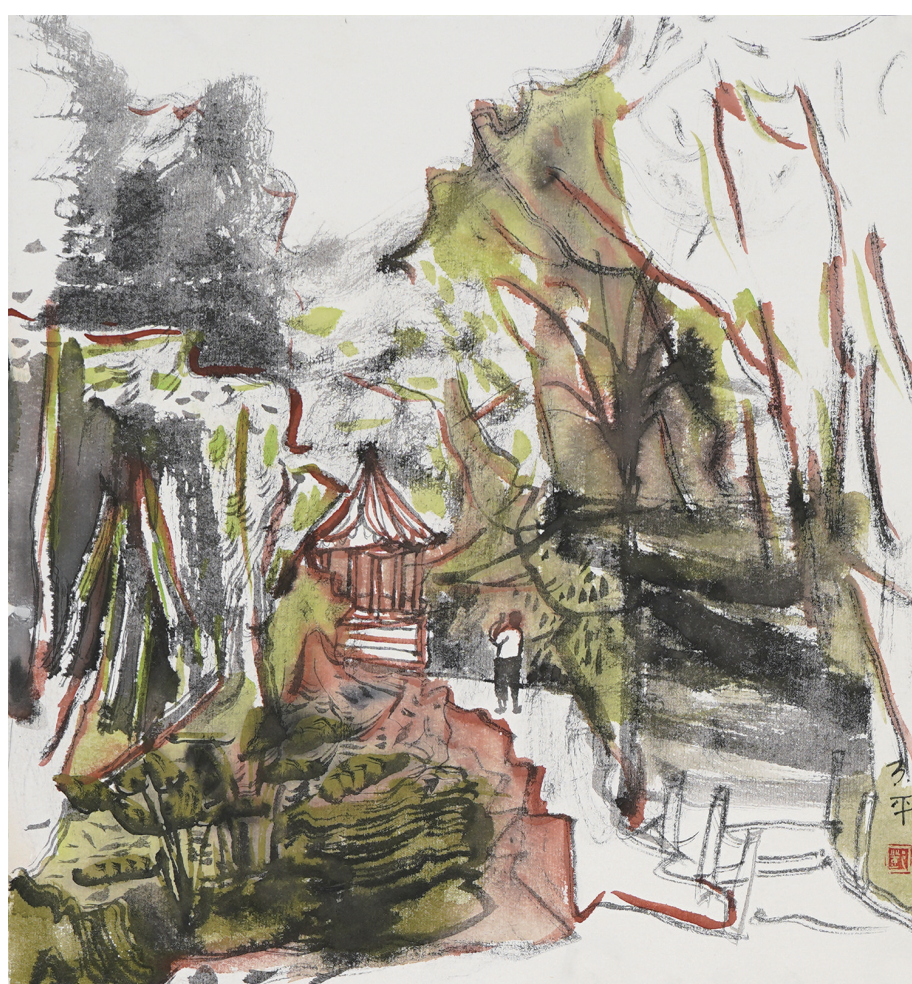
邓天平《春天的写生之一》中国画