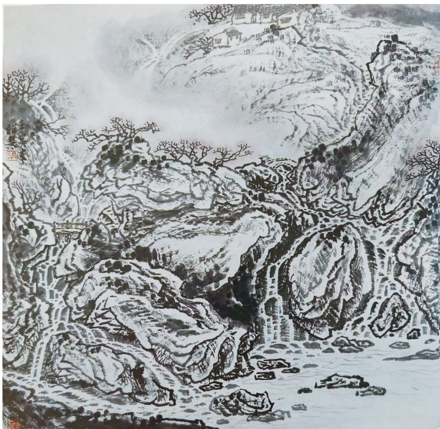
葛继慧《燕山山居》中国画