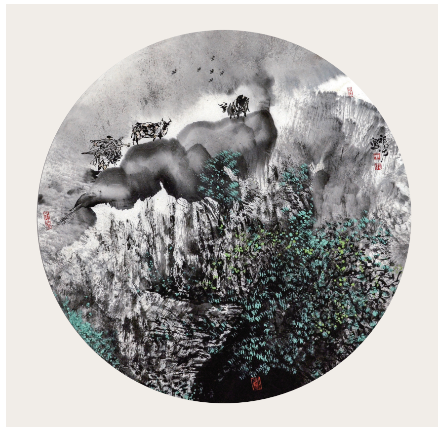
周祖光《春风又至》中国画