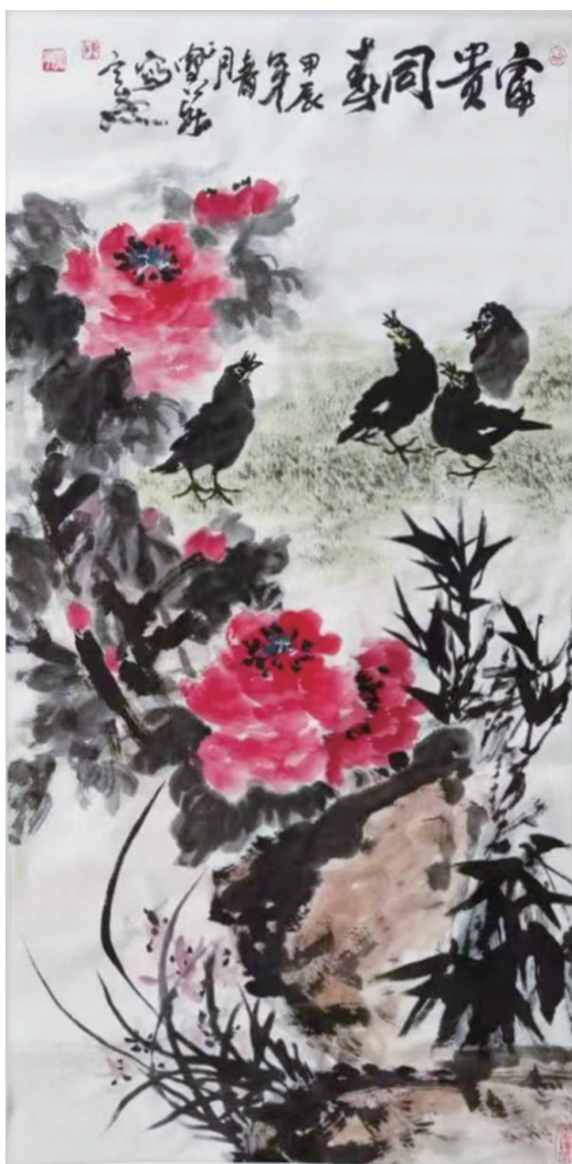
陈风华《富贵同春》中国画