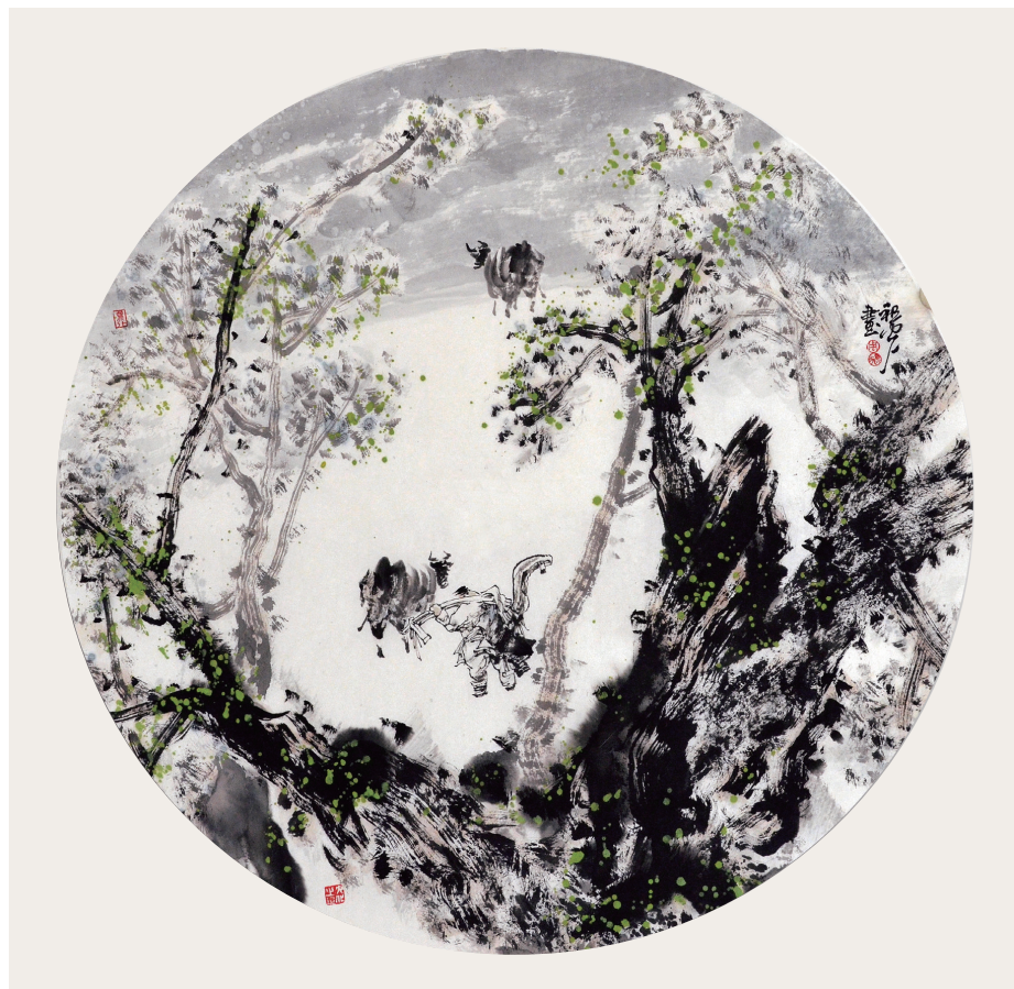
周祖光《春到农家》中国画