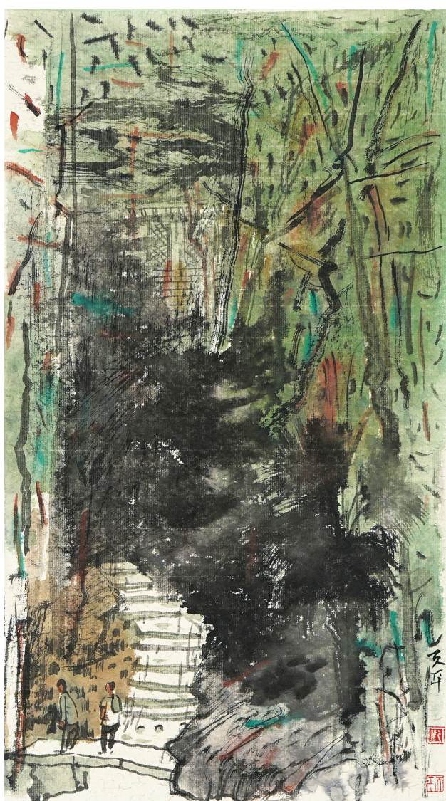
邓天平《春天的写生之二》中国画