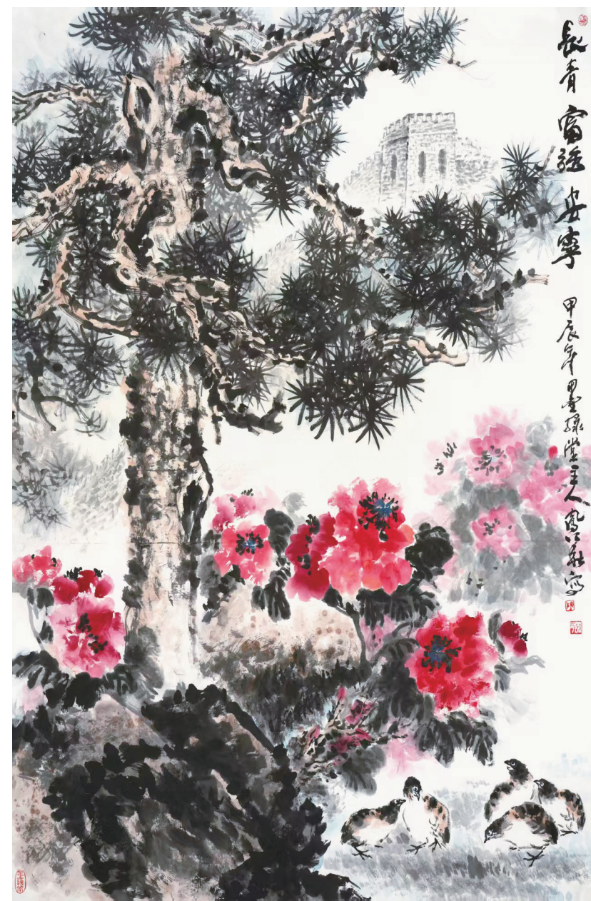
陈风华《长青富强安宁》中国画