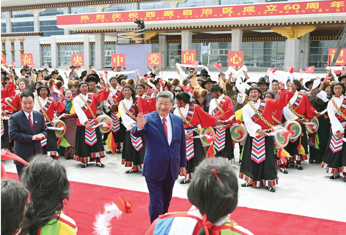
八月二十一日，中共中央总书记、国家主席、中央军委主席习近平在拉萨出席西藏自治区成立60周年庆祝活动后，乘专机返回北京。这是习近平在拉萨贡嘎机场向前来欢送的各族群众挥手致意。

新华社拉萨8月21日电 中共中央总书记、国家主席、中央军委主席习近平在拉萨出席西藏自治区成立60周年庆祝活动后，21日乘专机返回北京。受习近平总书记嘱托，以王沪宁为团长的中央代表团将于21日至23日在西藏各地看望慰问各族各界干部群众。