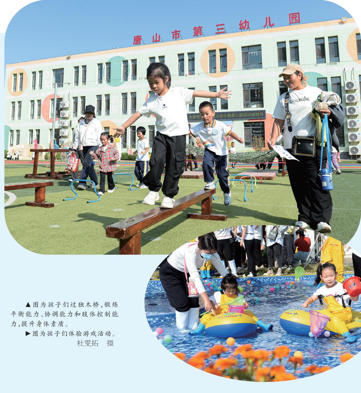
▲图为孩子们过独木桥,锻炼平衡能力、协调能力和肢体控制能力,提升身体素质。 ▶图为孩子们体验游戏活动。

本次培训有效提升了路南區卫健系统人员的应急响应能力和救护操作水平。该局将持续加强队伍建设,健全卫生应急体系,为守护全区居民健康不懈努力。