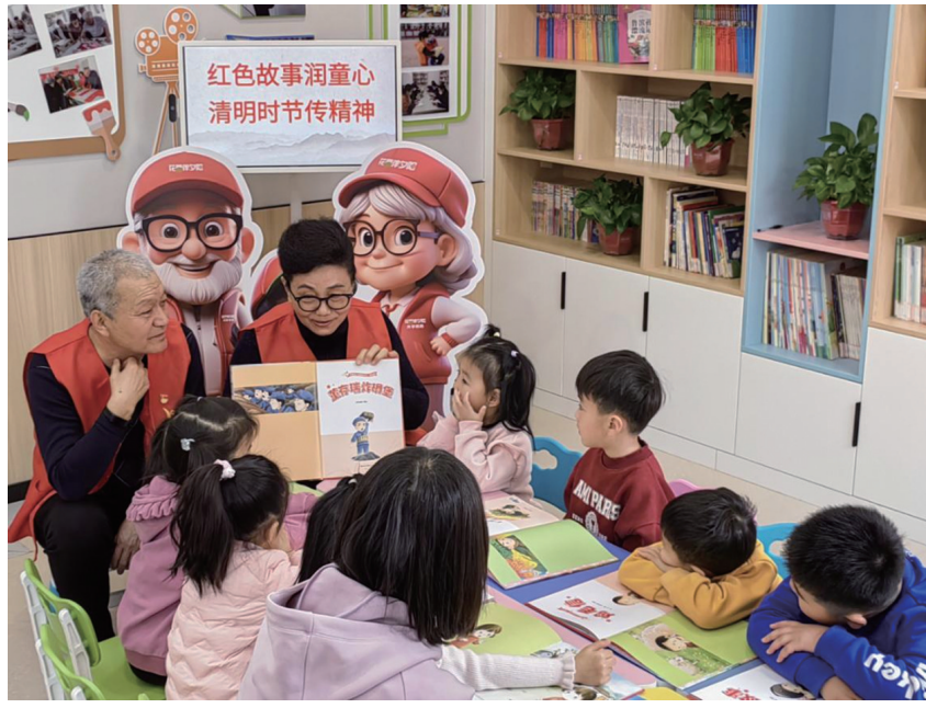
图为“共享爷爷奶奶”为孩子们讲解绘本故事。

面对商户密集、人流复杂等治理挑战,广场街道万达广场第二社区以“党建引领、社会化共建、网格化治理”破题,党代表、人大代表、政协委员、网格员、志愿