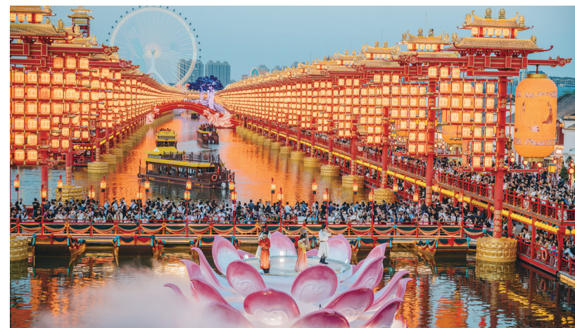
河头老街游人如潮，众多游客在此赏景游玩，共享欢乐时光。

本报讯(记者周枫)10月3日，国庆中秋假期进入第三天，河头老街迎来客流高峰，当日接待游客达13万人次，创下历史最高纪录。 据统计，截至10月3日，河头老街今年以来接待游客总量已突破600万人次。值得关注的是，在庞大的客流中，外地游客占比超过90%，其中来自北京的