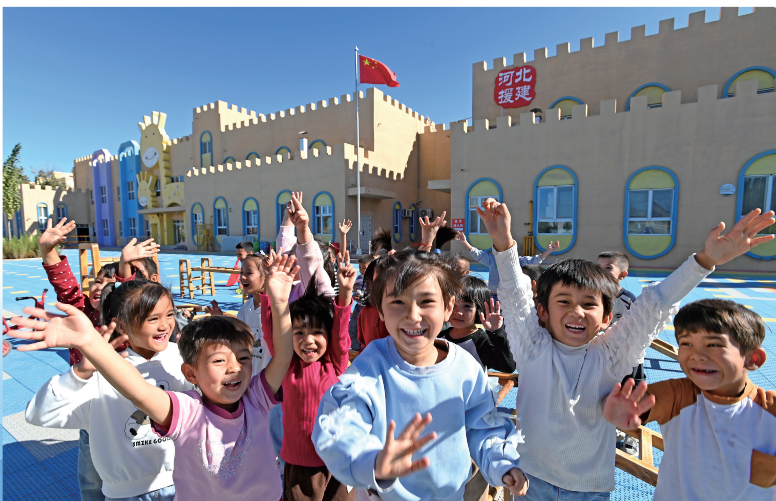
且末第四幼儿园里,漂亮的园舍、齐全的设备给小朋友们创造了良好的成长环境。