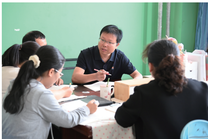
唐山援疆教师在为学生传授知识的同时,针对薄弱学科开展课堂问诊、课标培训、学生课业管理等工作,提高教学质量。