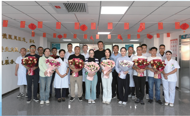
9月23日,新一批唐山柔性援疆医疗专家抵达且末人民医院。