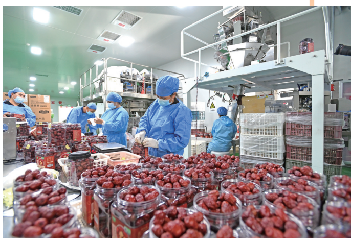
且末是红枣种植大县,第十批唐山援疆干部人才援助当地加工企业引进设备,促进企业增产,带动枣农增收。