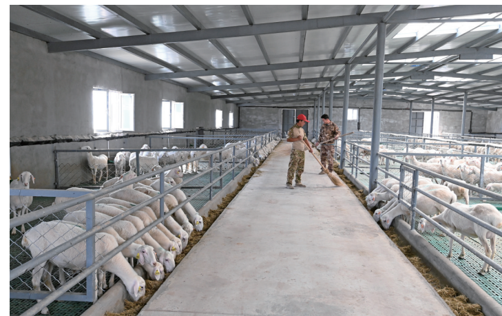
在且末县阿羌镇昆仑牧业有限公司,唐山援建的8个高标准养殖大棚促进了当地畜牧业的发展。