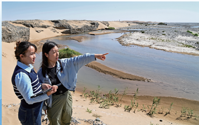
援疆专技人才正在与当地水利系统干部巡查车尔臣河,进一步排查河道管理范围内的“四乱”问题。