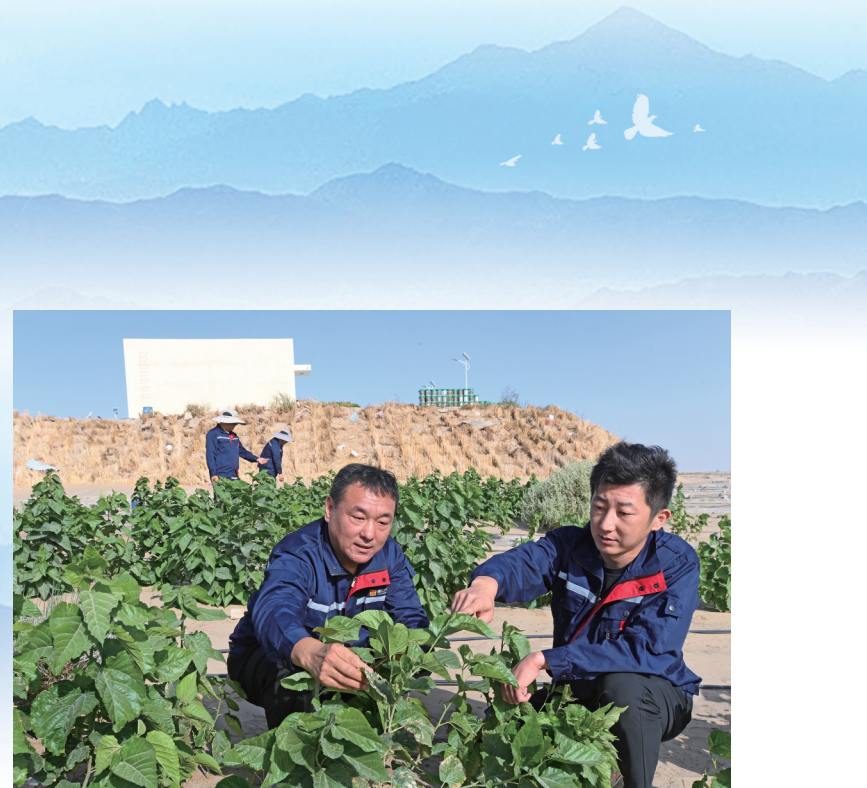
且末地处沙漠边缘,在防治治沙工作中,第十批唐山援疆干部人才开拓思路,引进唐山企业,种植耐旱耐沙且经济价值高的蛋白桑5000亩,为改善当地环境、促进农民增收探索了新路径。