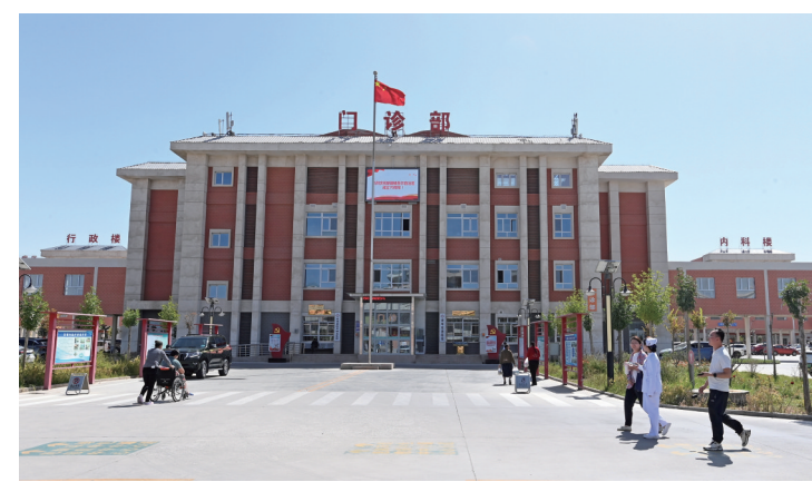
且末县人民医院门诊楼的建成改善了百姓的就医环境。