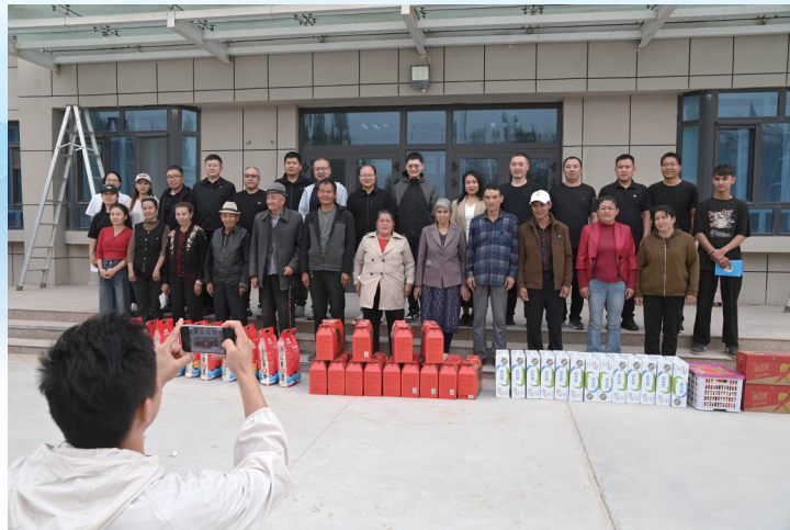
我市援疆干部人才与当地群众结亲戚,定期走访慰问,办实事、解难题。

800多个日升月落,是他们扎根边疆的坚定刻度;72个落地项目,是他们绘就蓝图的实干答卷。第十批唐山援疆干部人才和且末干部群众一道践行使命,倾心助力——