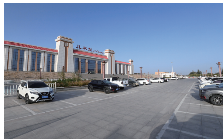
且末火车站站前广场项目改善了当地百姓的出行环境。