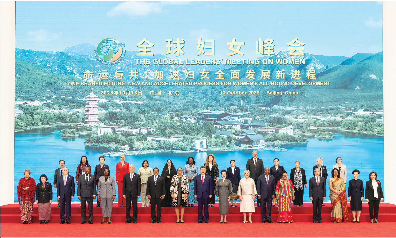
10月13日上午，国家主席习近平在北京国家会议中心出席全球妇女峰会开幕式并发表主旨讲话。这是习近平和夫人彭丽媛同与会各国和国际组织代表团团长夫妇合影留念。

新华社北京10月13日电(记者马卓言、董博婷)10月13日上午，国家主席习近平在北京国家会议中心出席全球妇女峰会开幕式并发表主旨讲话。