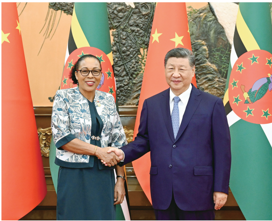
10月14日上午,国家主席习近平在北京人民大会堂会见来华出席全球妇女峰会的多米尼克总统伯顿。

阿马拉苏里亚转达迪萨纳亚克总统对习近平主席的诚挚问候,表示习近平主席在全球妇女峰会上的讲话意义深远,彰显中国为促进世界妇女事业发挥的重要领导作用。斯里兰卡高度重视对华关系,坚定恪守一个中国原则,积极支持和参与高质量共建“一带一路”。感谢中方为斯里兰卡经济社会发展提供的宝贵支持,希望学习借鉴中国式现代化经验,进一步密切对华合作,实现自身新发展。习近平主席提出的四大全球倡议在当前动荡国际局势下具有重要意义,斯方将与中方共同践行,维护全球南方共同利益。王毅参加会见。