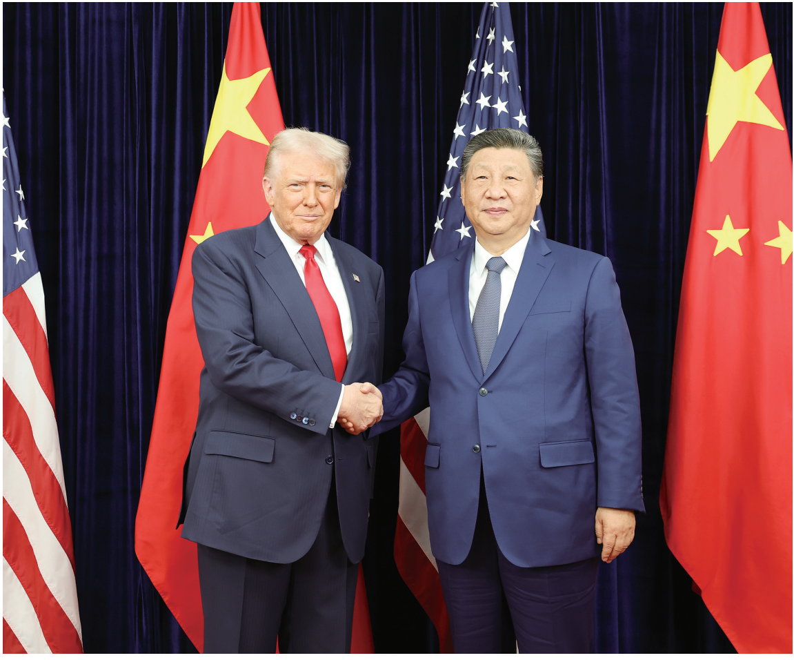
当地时间十月三十日，国家主席习近平在釜山同美国总统特朗普举行会晤。

新华社韩国釜山10月30日电（记者李忠发、郝薇薇）当地时间10月30日，国家主席习近平在釜山同美国总统特朗普举行会晤。 习近平指出，中美关系在我们共同引领下，保持总体稳定。两国做伙伴、做朋友，这是历史的启示，也是现实的需要。两国国情不同，难免会有一些分歧，作为世界前两大经济体，时而有摩擦，这很正常。面对风浪和挑战，两国元首作为掌舵人，应当把握好方向、驾驭住大局，让中美关系这艘大船平稳前行。我