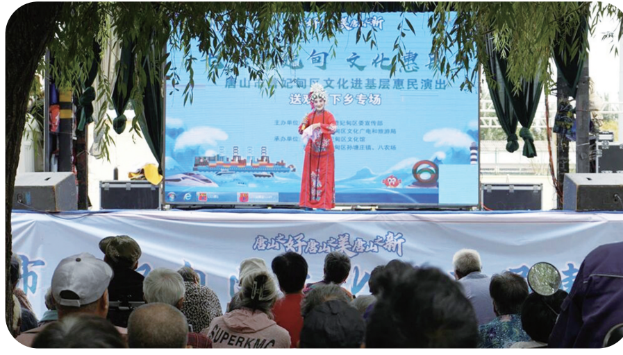
图为活动现场。

以“发现唐山之美”为主题的曹妃甸文旅推介展示活动，更是将非遗展示、文创展销、美食体验、文艺演出、文旅推介融为“五位一体”，原创歌曲《畅游曹妃甸》《奇幻曹妃甸》将地域旅游文化唱进人心。揽月湾、