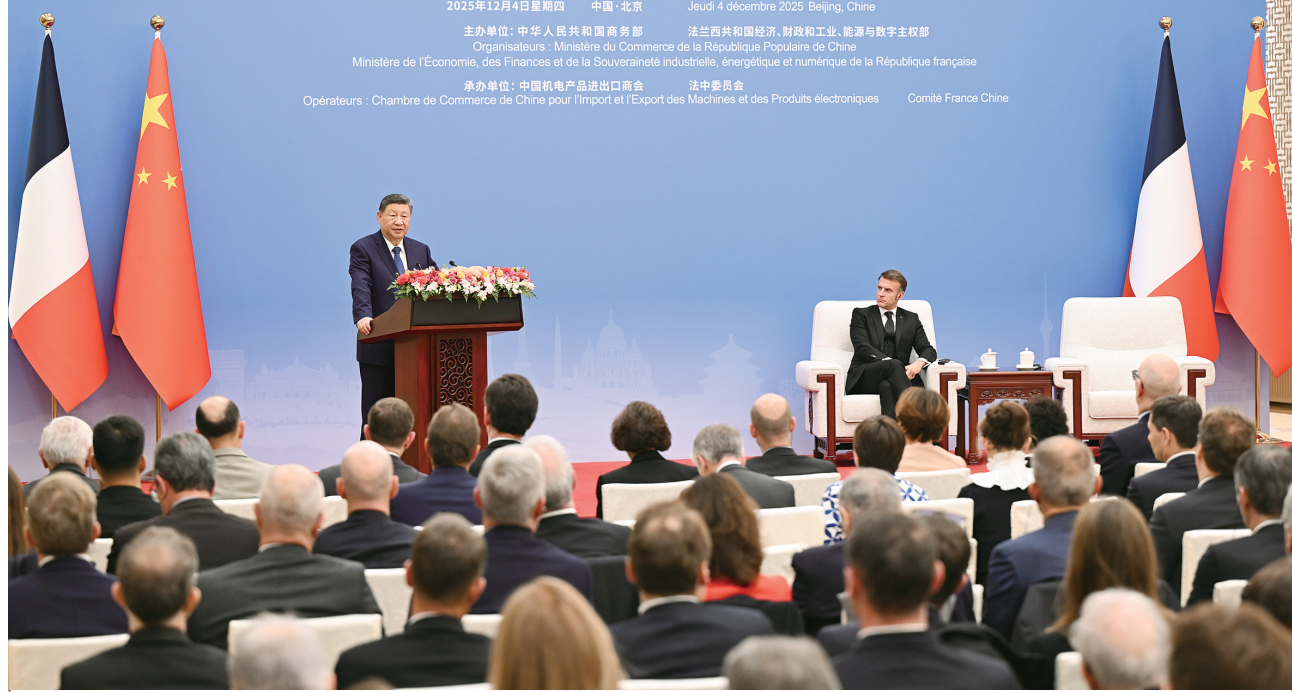
12月4日中午，国家主席习近平在北京同法国总统马克龙共同出席中法企业家委员会第七次会议闭幕式并致辞。

中法企业家委员会第七次会议 7 E RÉUNION DU CONSEIL D'ENTREPRISES FRANCO-CHINOIS