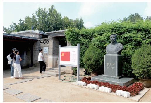
乐亭县大黑坨村李大钊故居院内,参观者在李大钊半身铜像前,驻足凝视,聆听讲解。