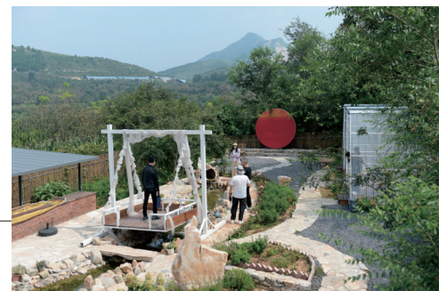
如今,沙石峪人传承红色基因,将精神力量转化为发展动能。村党支部带领村民转型葡萄种植,打造千亩“致富园”,户均年收入超十万元;同时融合红色研学与乡村旅游,建成全国爱国主义教育基地,发展特色民宿,让昔日穷山沟变身全国文明村、生态文化村。