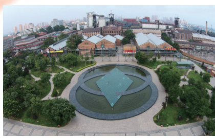
1925年12月,毛泽东发表《中国社会各阶级的分析》,对工人阶级革命斗争精神给予高度赞扬,这种精神也成为以开滦矿工为代表的工人阶级的标志性格。