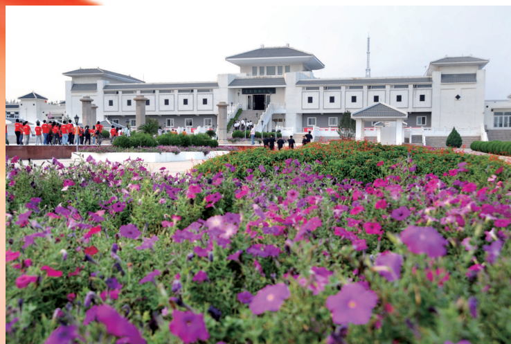
乐亭县李大钊纪念馆前,花草盛放、花香四溢,游客在生机盎然的氛围中感悟革命先驱的精神。