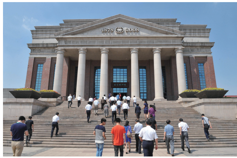
游客参观开滦博物馆。