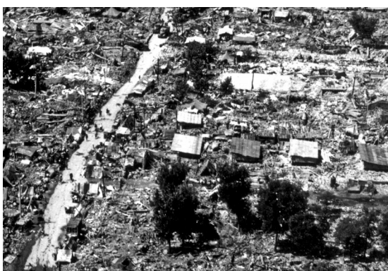
1976年7月28日,7.8级大地震将唐山夷为废墟,却没能摧毁这座城市的脊梁。(资料)