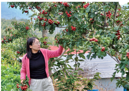
如今,富裕起来的遵化县西铺村村民办起了家庭农场,吸引游客前来采摘。