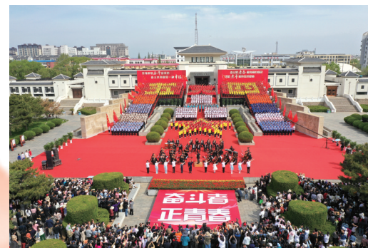
大钊精神激励着一代又一代唐山人。