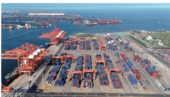
震后,唐山不仅结束了有海无港的历史,还创造出吞吐量世界第二的奇迹。