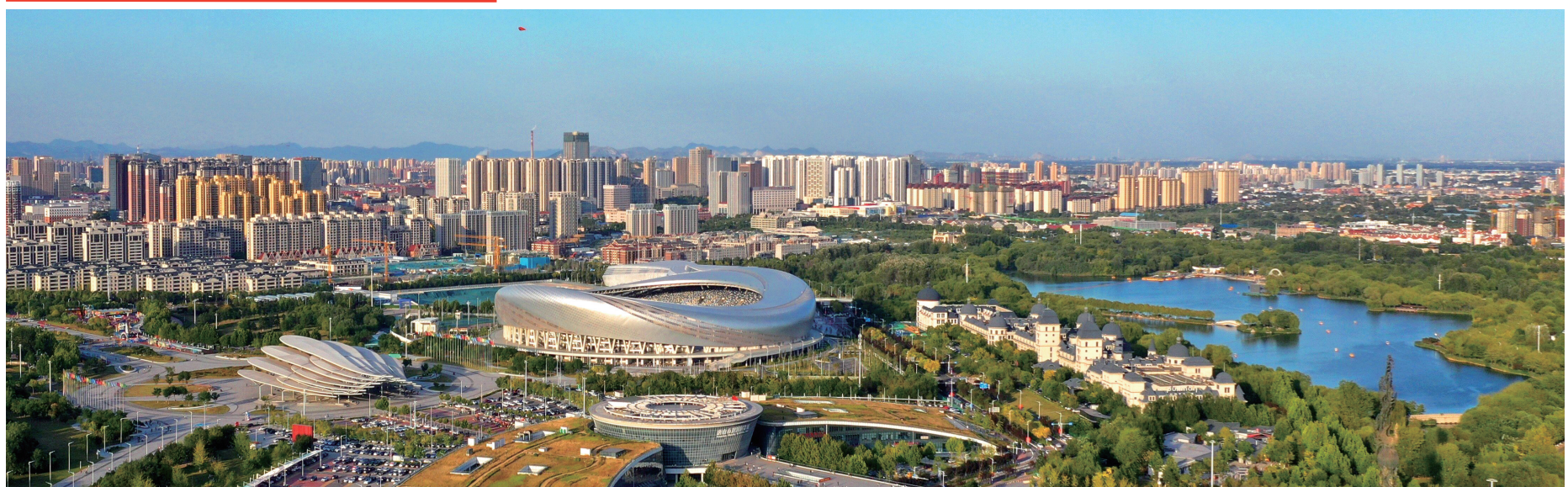
唐山以惊人的勇气和韧劲创造了十年重建、十年振兴和二十多年快速发展的唐山奇迹,铸就了“公而忘私、患难与共、百折不挠、勇往直前”的唐山抗震精神。这一精神不仅是唐山人民的精神丰碑,更是中华民族在灾难面前不屈不挠、自强不息的生动写照。