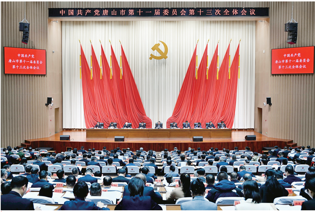
中国共产党唐山市第十一届委员会第十三次全体会议,于2025年12月6日在市委党校举行。

全会充分肯定市委常委会的工作。一致认为,市委常委会坚持以习近平新时代中国特色社会主义思想为指导,深入学习贯彻党的二十届四中全会和省委十届九次全会精神,全面落实习近平总书记对河北、对唐山工作重要指示精神和党中央决策部署及省委工作安排,团结带领全市广大党员干部群众,牢记嘱托、感恩奋进,一手抓全面从严治党,一手抓高质量发展,两手抓、两手硬、两不误,扎实开展深入贯彻中央八项规定精神学习教育,推动经济运行稳中有进、稳中向好,全市各项事业发展取得新成效。全会充分肯定“十四五”时期唐山发展取得的成绩。一致认为