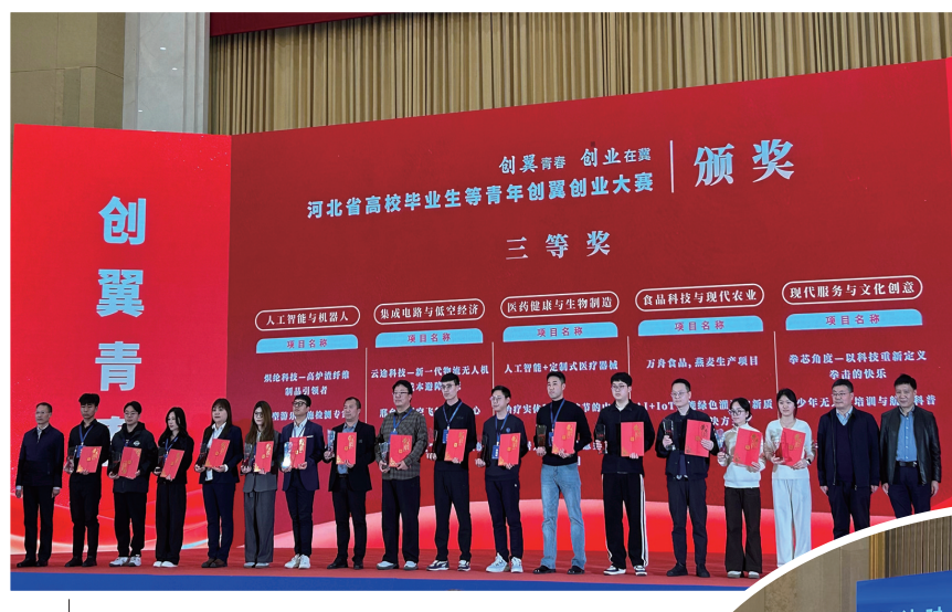
▲河北省高校毕业生等青年创翼创业大赛决赛颁奖仪式。 ▶河北省高校毕业生等青年创翼创业大赛决赛现场,我市“青银共创——智慧康养服务平台”项目正在答辩。