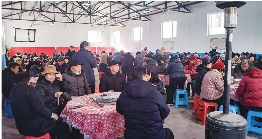
图为村民欢聚一堂过冬至吃饺子。

一碗饺子,一份温情;一场相聚,一种传承。于林庄村的百人饺子宴,用最朴实的方式诠释了“邻里同心”的真谛,也为这个寒冷的冬至增添了最温暖的底色。