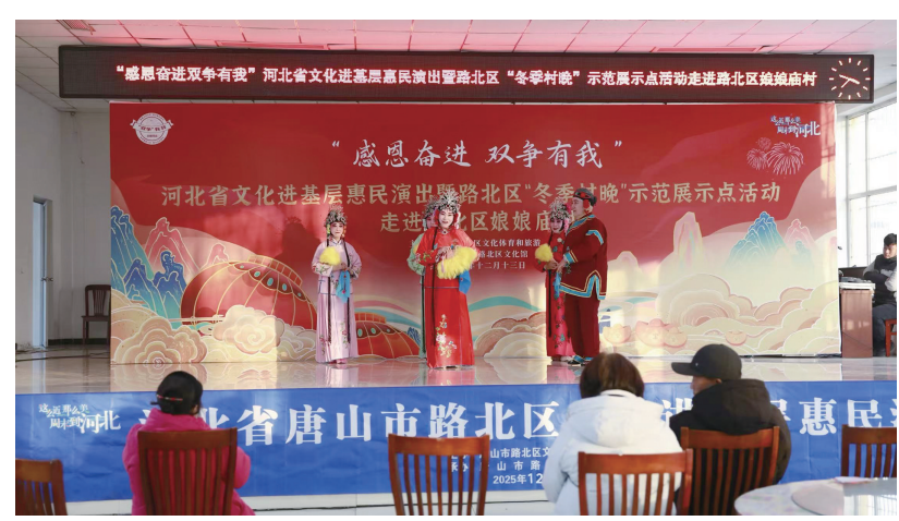
图为活动现场。