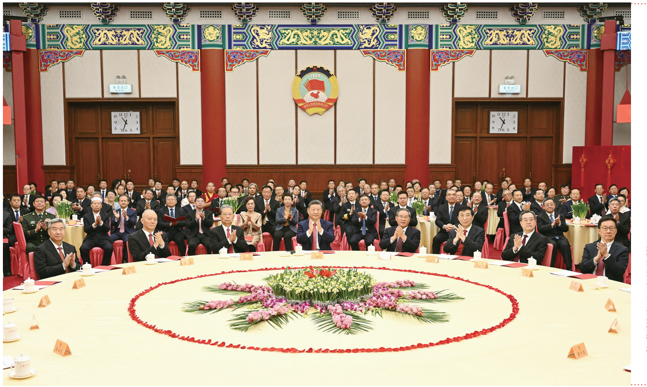
十二月三十一日，全国政协在北京举行新年茶话会。党和国家领导人习近平、李强、赵乐际、王沪宁、蔡奇、丁薛祥、李希、韩正出席茶话会并观看演出。

新华社北京12月31日电 中国人民政治协商会议全国委员会12月31日上午在全国政协礼堂举行新年茶话会。党和国家领导人习近平、李强、赵乐际、王沪宁、蔡奇、丁薛祥、李希、韩正等同各民主党派中央、全国工商联负责人和无党派人士代表、中央和国家机关有关方面负责人以及首都各族各界人士代表欢聚一堂，共迎2026年元旦。 中共中央总书记、国家主席、中央军委主席习近平发表重要讲话。他强调，蓝图已经绘就，奋进正当其时。全党全国各族人民要更加紧密地团结起来，万众一心、奋发进取，以实干成就伟业，以创新赢得未来，不断开创中国式现代化建设新局面。 习近平代表中共中央、国务院和中央军委，向各民主党派、工商联和无党派人士，向全国各族人民，向香港同胞、澳门同胞、台湾同胞和海外侨胞，向关心和支