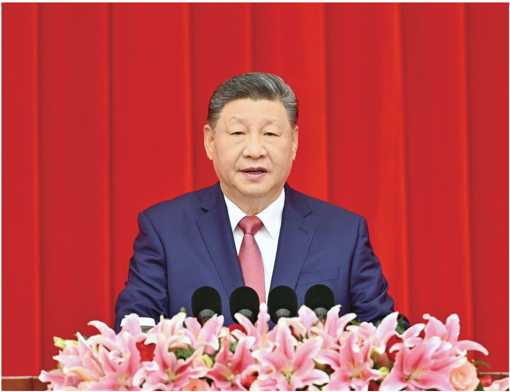
十二月三十一日，全国政协在北京举行新年茶话会。中共中央总书记、国家主席、中央军委主席习近平在茶话会上发表重要讲话。