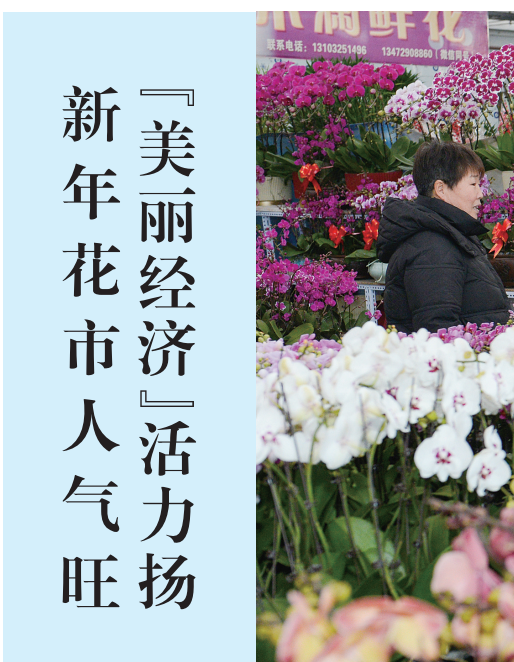
「美丽经济」活力扬 新年花市人气旺

本次展出是成贵民从30多年拍摄的唐山人物中精选的。30幅作品中,有飞车进京报告唐山地震灾情