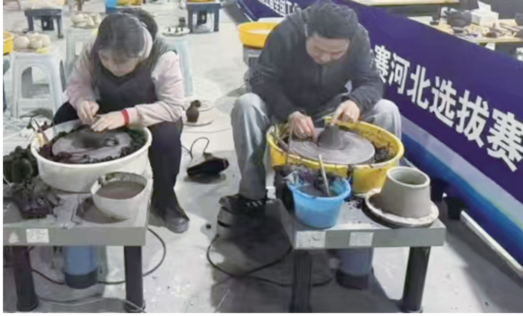
图为2025年省轻工业设计行业职业技能大赛暨第五届全国工业设计职业技能大赛河北选拔赛中,陶瓷产品设计师比赛现场。