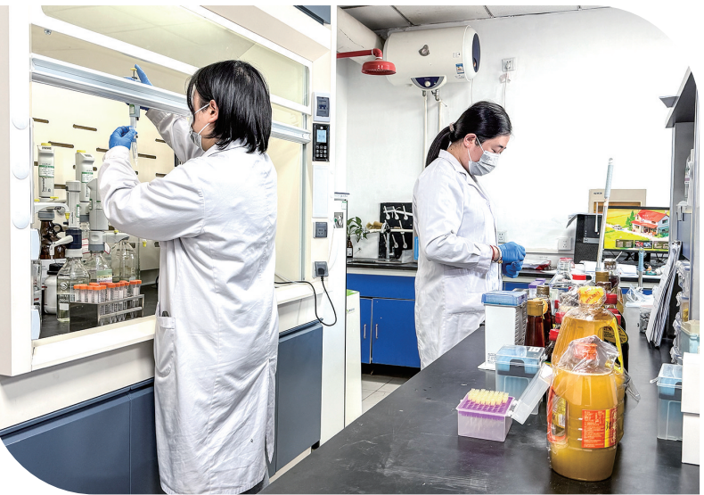
检测人员正在对样品进行检测。

“国字号”认证不是终点,而是新的起点。市农业农村局表示,随着人们对农产品质量安全和健康要求日益提高,全国名特优新产品和特质农产品的认定工作将愈发受到重视。该局将不断加强农产品质量安全监管,完善检验检测体系建设,推动绿色优质农产品发展,让更多老百姓享受到安全、健康、营养的农产品。