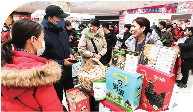
琳琅满目的绿色优质农产品吸引市民争相选购。

2025年12月30日,唐山远洋城购物中心一层大厅内人头攒动,热闹非凡,由唐山市农业农村局举办的2025年绿色优质农产品展示展销活动在此盛大启幕。此次活动,由唐山市农业农村局联合20余家唐山本地农业企业、专业合作社,将获得中国绿色食品发展中心、农业农村部农产品质量安全中心等国家级机构认证的全国名特优新产品、特质农产品、绿色食品等进行集中展示,搭建了消费者与绿色优质农产品“零距离”接触的桥梁。各参展企业依次登台,详细推介自家产品特色与品质优势,让市民更直观地了解本土优质农产品,充分展现了唐山绿色农业的发展实力。这不仅是我市绿色优质农产品的一次集中亮相,更是我市农业向高质量、高标准迈进的有力见证。