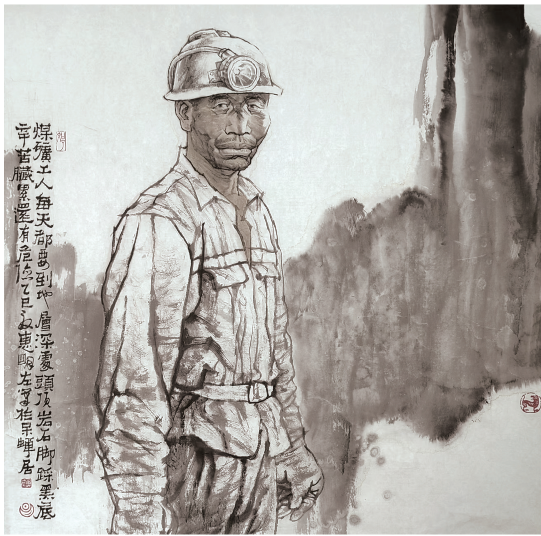
薄惠明《煤矿工人》中国画