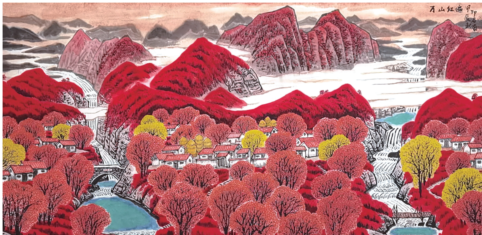
李印启《万山红遍》中国画