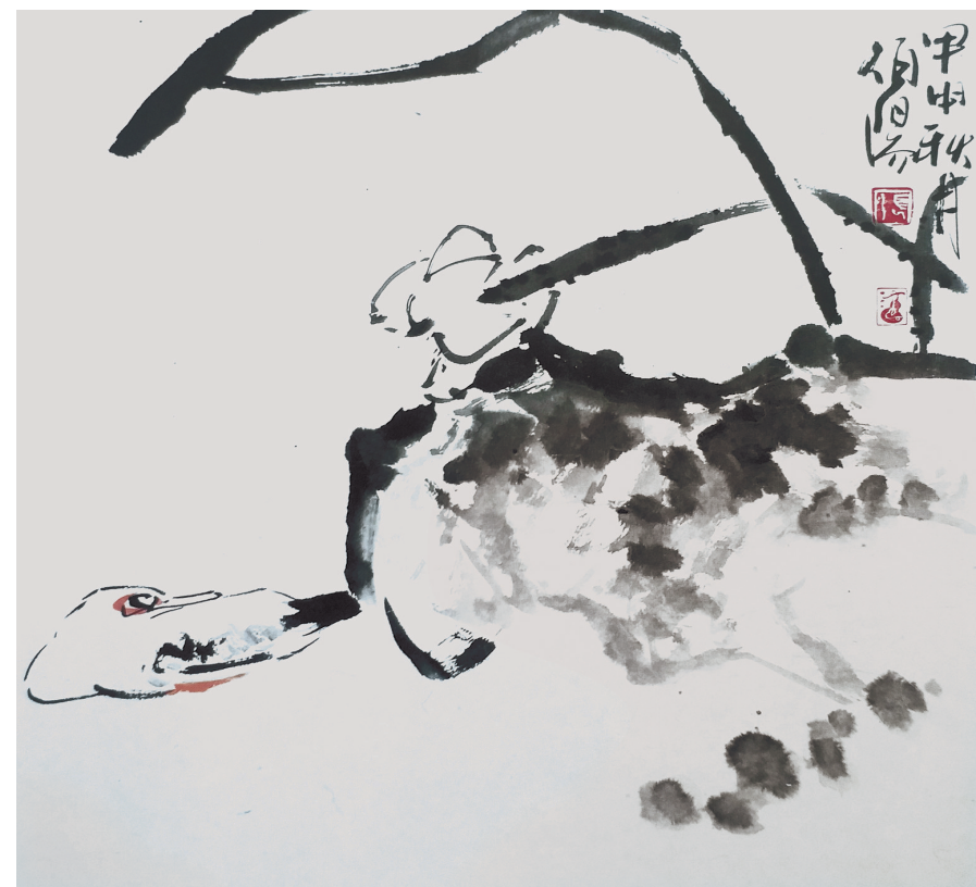
张伯阳《荷塘》中国画