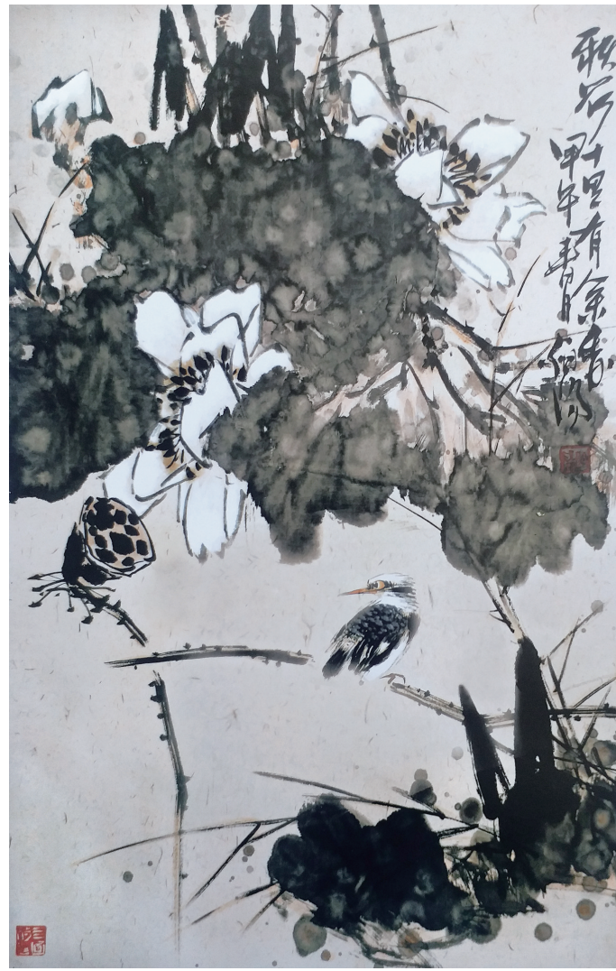
张伯阳《秋荷》中国画