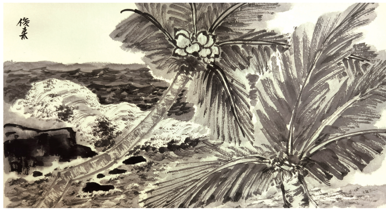
张俊来《写生2》中国画