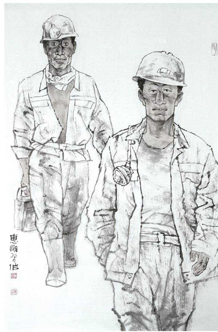
薄惠明《矿工图》中国画