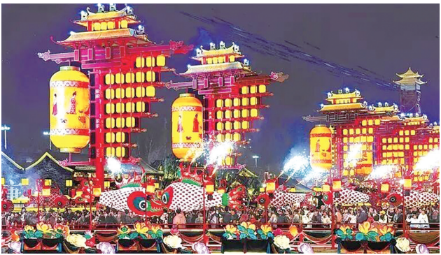
2月17日、18日,《经济日报》《人民日报》均在1版刊发图片新闻,对我市河头老街进行报道。