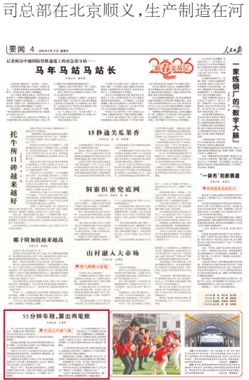
人民日报、经济日报

2月15日,《人民日报》4版刊发题为《55分钟车程,算出两笔账》消息,介绍京唐通勤如串门,人才产业双向奔赴。