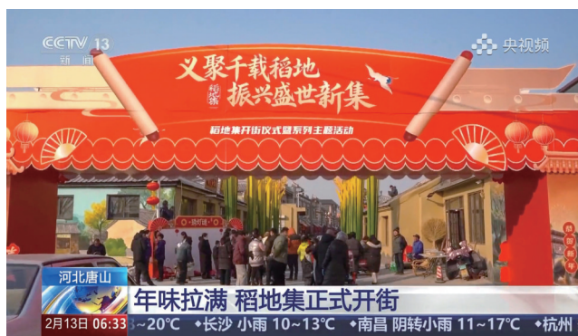
2月13日,央视《朝闻天下》播出《年味拉满 稻地集正式开街》。2月10日农历小年,在河北唐山的稻地集上,本地红薯、双黄蛋、萝卜糖等产品受到消费者的青睐。