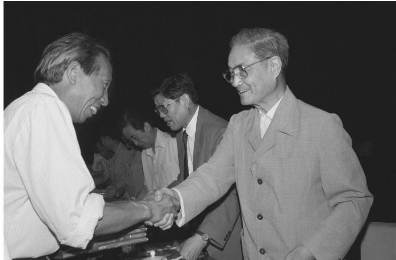
1991年6月26日,中共中央组织部、中共中央宣传部等单位在北京召开大会,表彰全国高校优秀思想政治工作者。这是宋平同志(右)向获奖的个人颁奖。