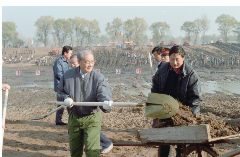
1991年11月13日,宋平同志(左)来到北京市通州区张家湾凉水河整治工程工地参加劳动。

中国共产党的优秀党员,久经考验的忠诚的共产主义战士,杰出的无产阶级革命家、政治家,党和国家的卓越领导人,中国共产党第十三届中央政治局常委,原国务委员宋平同志,因病医治无效,于2026年3月4日15时36分在北京逝世,享年109岁。