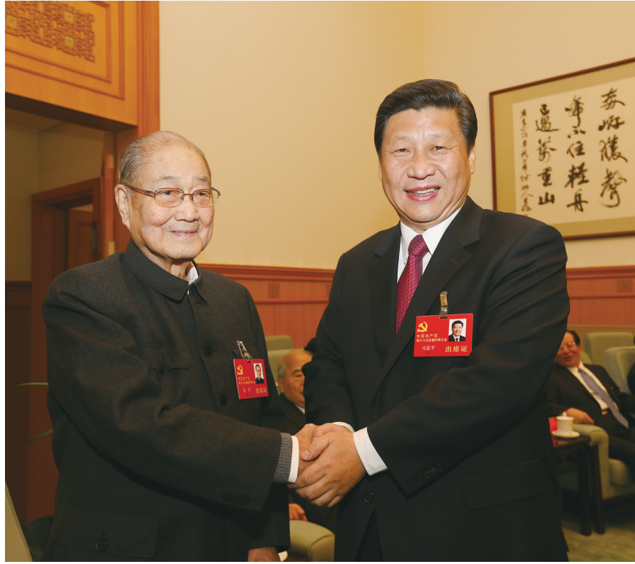
二〇一二年十一月十四日,在党的十八大大会前,习近平同志同宋平同志在一起。