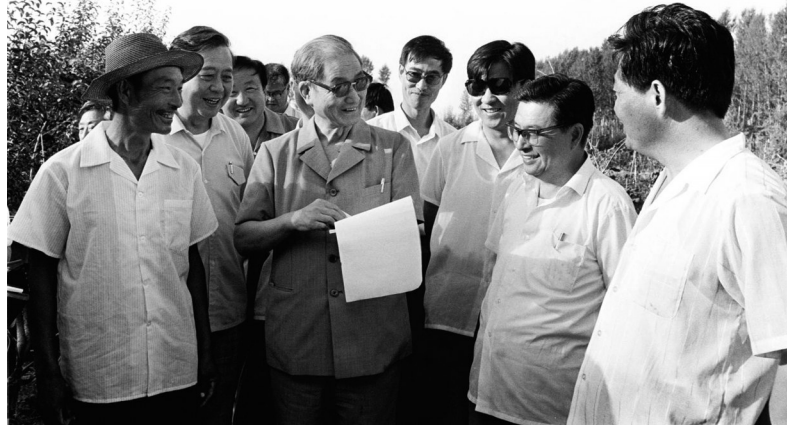
1990年7月中下旬,宋平同志(前左二)来到内蒙古自治区巴彦淖尔市临河区马场地村了解基层党支部建设情况。