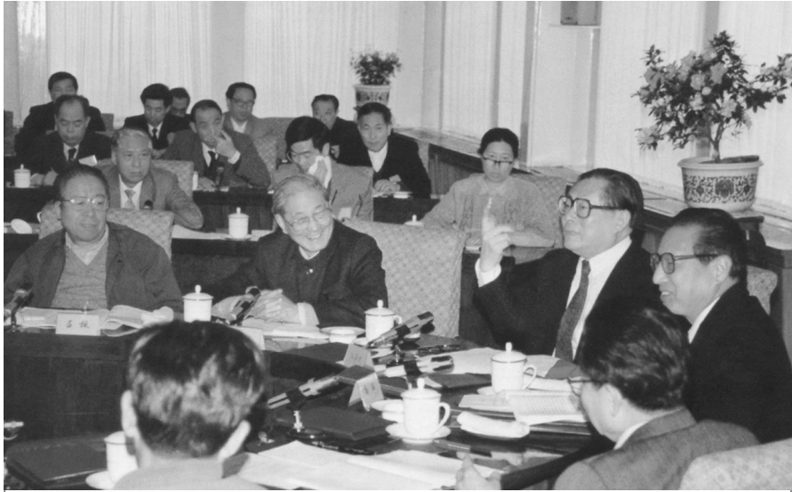
1991年4月,江泽民同志、宋平同志(前排左二)等与参加党建理论讨论会的代表座谈。