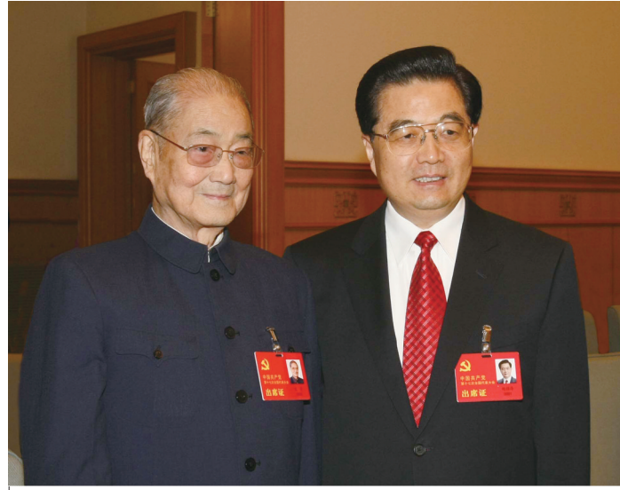
2007年10月21日,在党的十七大大会前,胡锦涛同志同宋平同志在一起。